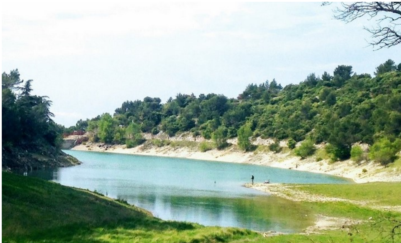
Le Lac du Paty à Caromb