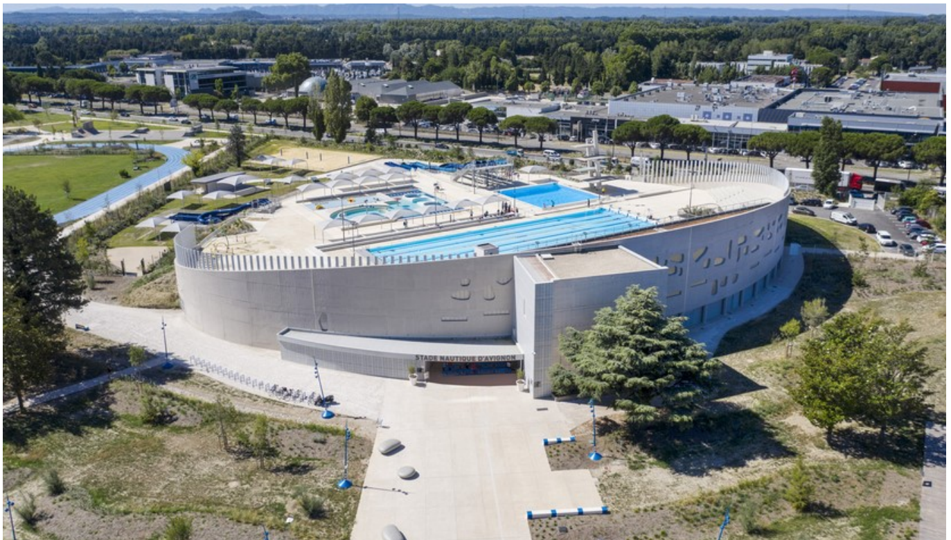
DR Le stade nautique à Avignon

http://www.avignon.fr/espaces-culturels-et-sportifs/les-piscines-municipales/