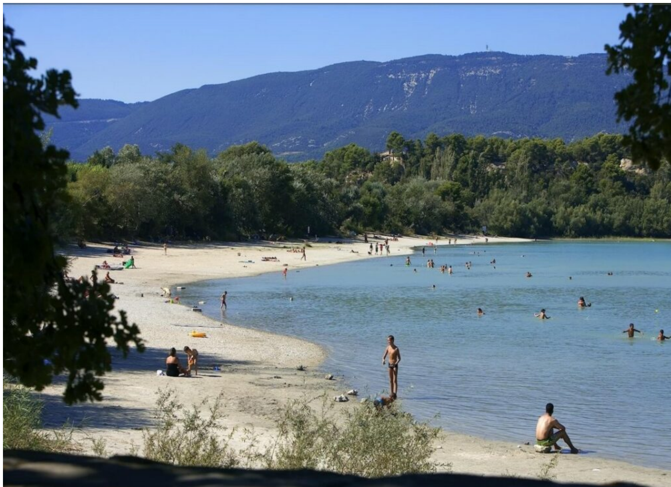
DR Etang de la Bonde à Cabrières d'Aigues

situé au Camping Val de Durance, ce plan d'eau dispose d'une plage aménagée, ainsi qu'une zone de pêche. Accès payant pour les personnes extérieures au camping (adultes 6€, enfants 3€). Ce lac naturel de 3 hectares dispose d'une plage de sable fin accueillant les amateurs de baignades, de baignades de soleil et, en haute saison, d'activités nautiques. La sécurité des baigneurs est assurée par des maîtres-nageurs. Le lac est ouvert jusqu'au 31 août. Un petit snack propose boissons et encas. Il est bien sûr possible d'apporter son pique-nique.