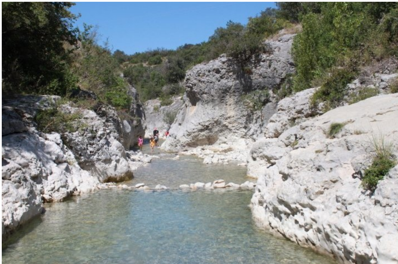
Les gorges du Toulourenc

Gorges du Toulourenc à Malaucène, Entrechaux et Saint-Léger du Ventoux.