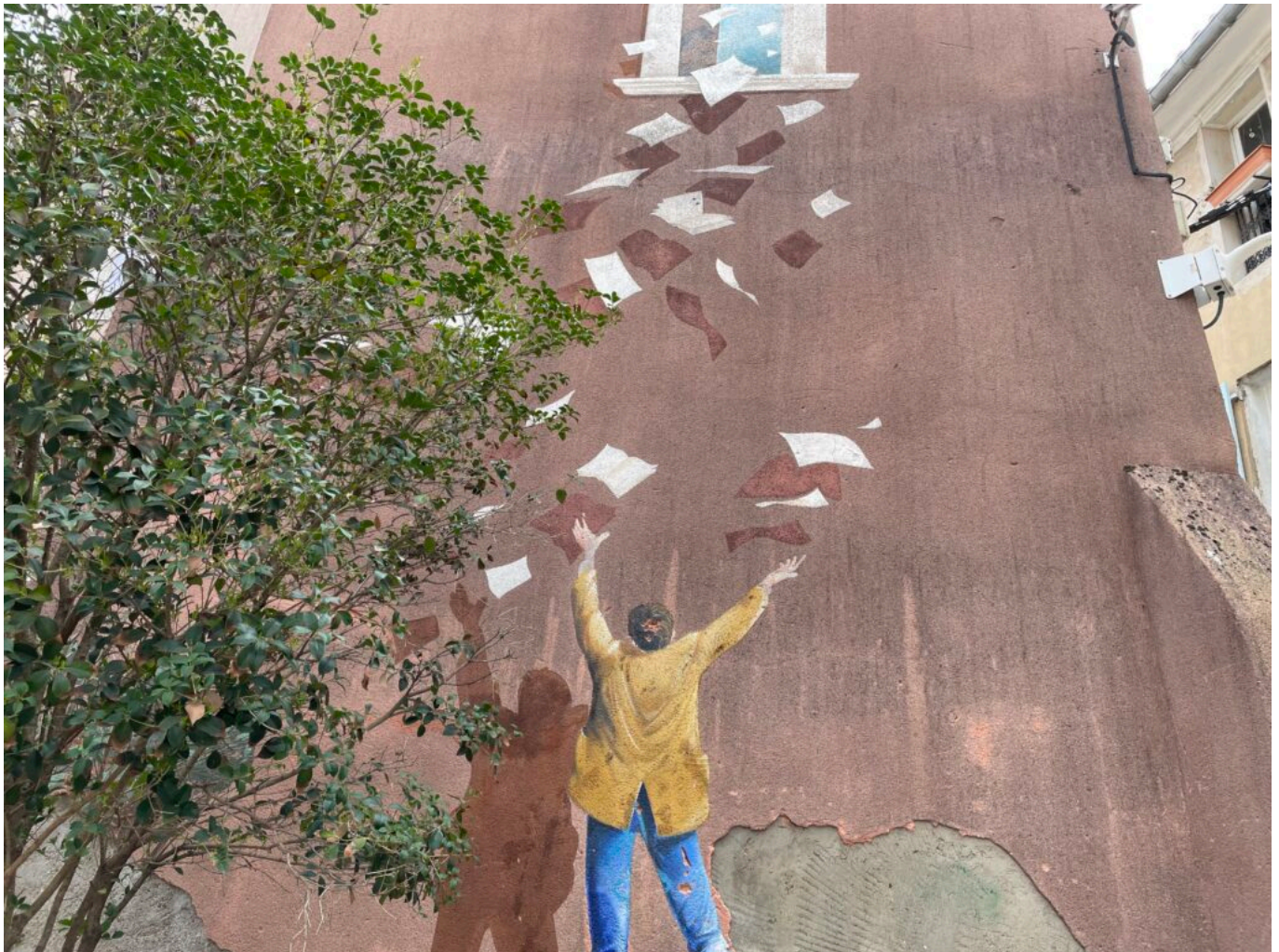
Fresque dans une rue de l'Isle sur la Sorgue