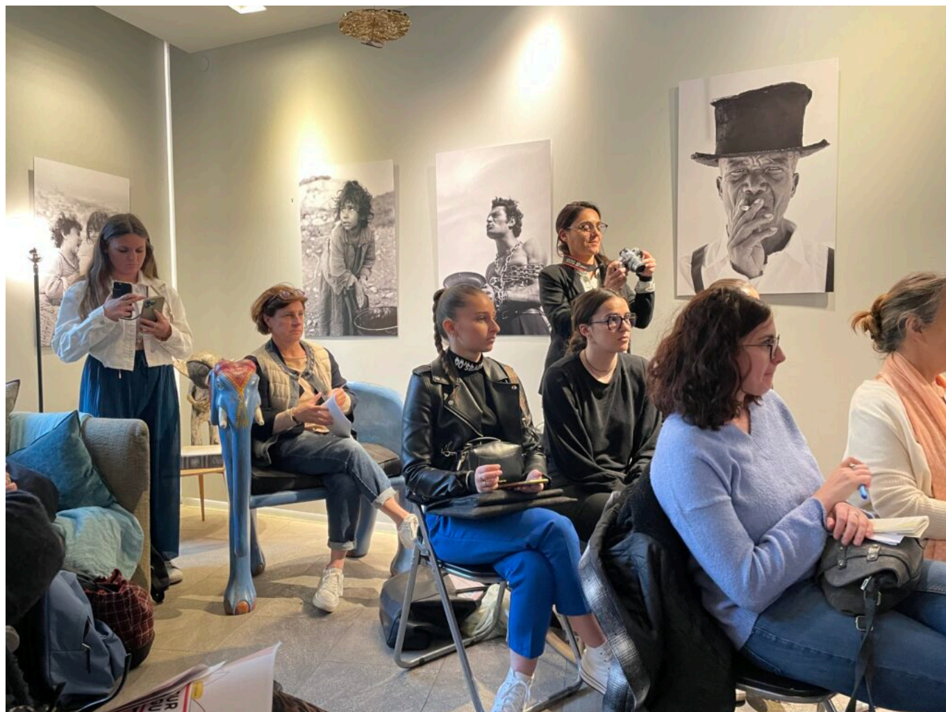
Au mur, les œuvres de l'immense photographe Hans Silvester

vont dérouler la belle initiative de Lire sur la Sorgue qui réunit toute l'année les personnes les plus éloignées de la lecture, tous ceux qui aiment lire, ouvrir des bandes dessinées, jusqu'au cœur des entreprises où l'on fait alliance grâce à ces pages que l'on tourne ensemble. Bref, on y œuvre à ce qu'il y a de plus compliqué et de plus beau : faire société.