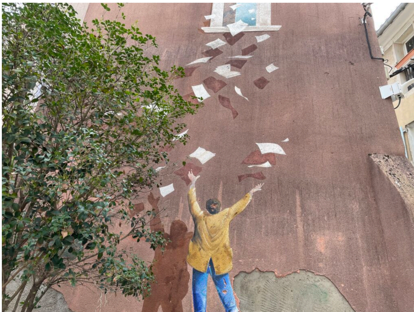
Fresque dans une rue de l'Isle sur la Sorgue