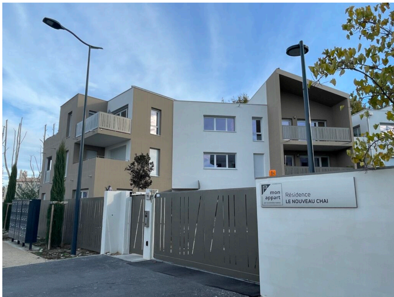
Le Nouveau Chai à Châteauneuf-de-Gadagne