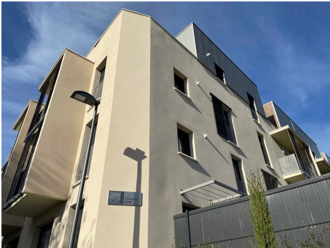
Le 110 à Cavaillon