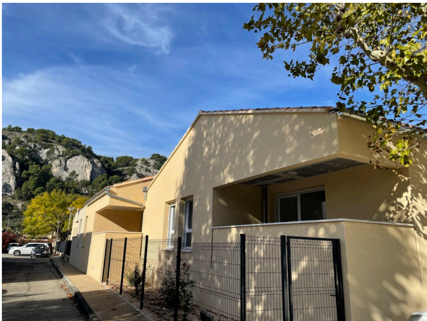
Le Petit Luberon à Cavailon, résidence Seniors pour personnes autonomes

novembre 2021 et la résidence Auréus qui proposera 38 logements collectifs pour la location pour un peu plus de 4,7M€ ; La résidence Le Lys au Thor qui propose 24 logements collectifs et 6 logements individuels pour près de 7,7M€ ; et, enfin, la Résidence Le Bleu du Ciel à Caumont-sur-Durance constituée de 36 logements, dont 9 proposés à la location pour un peu plus de 1,2M€.