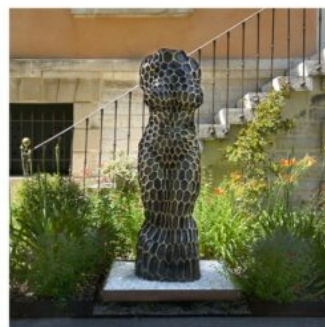
Faire corps