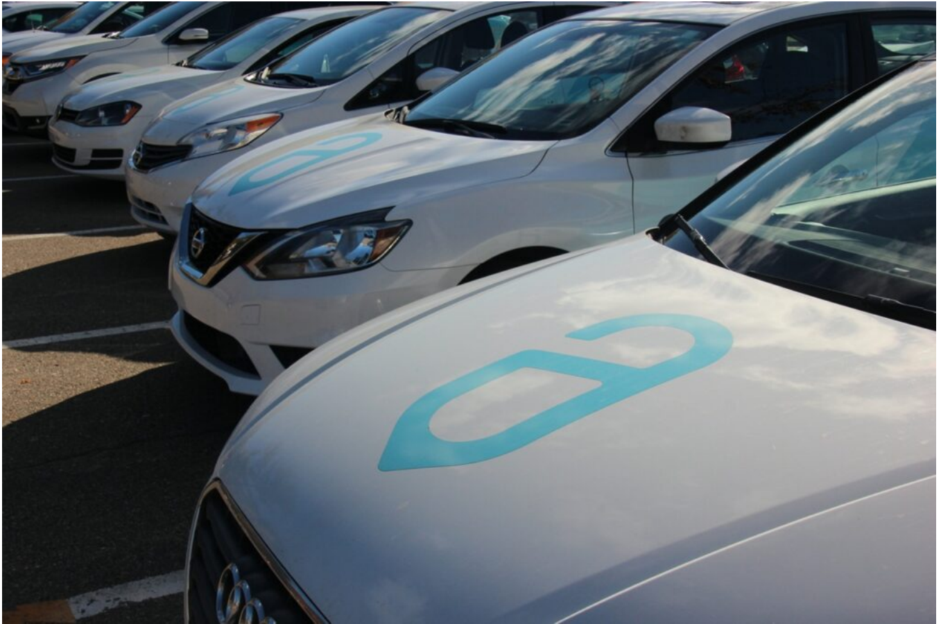
Véhicules floqués avec le logo de l'entreprise.