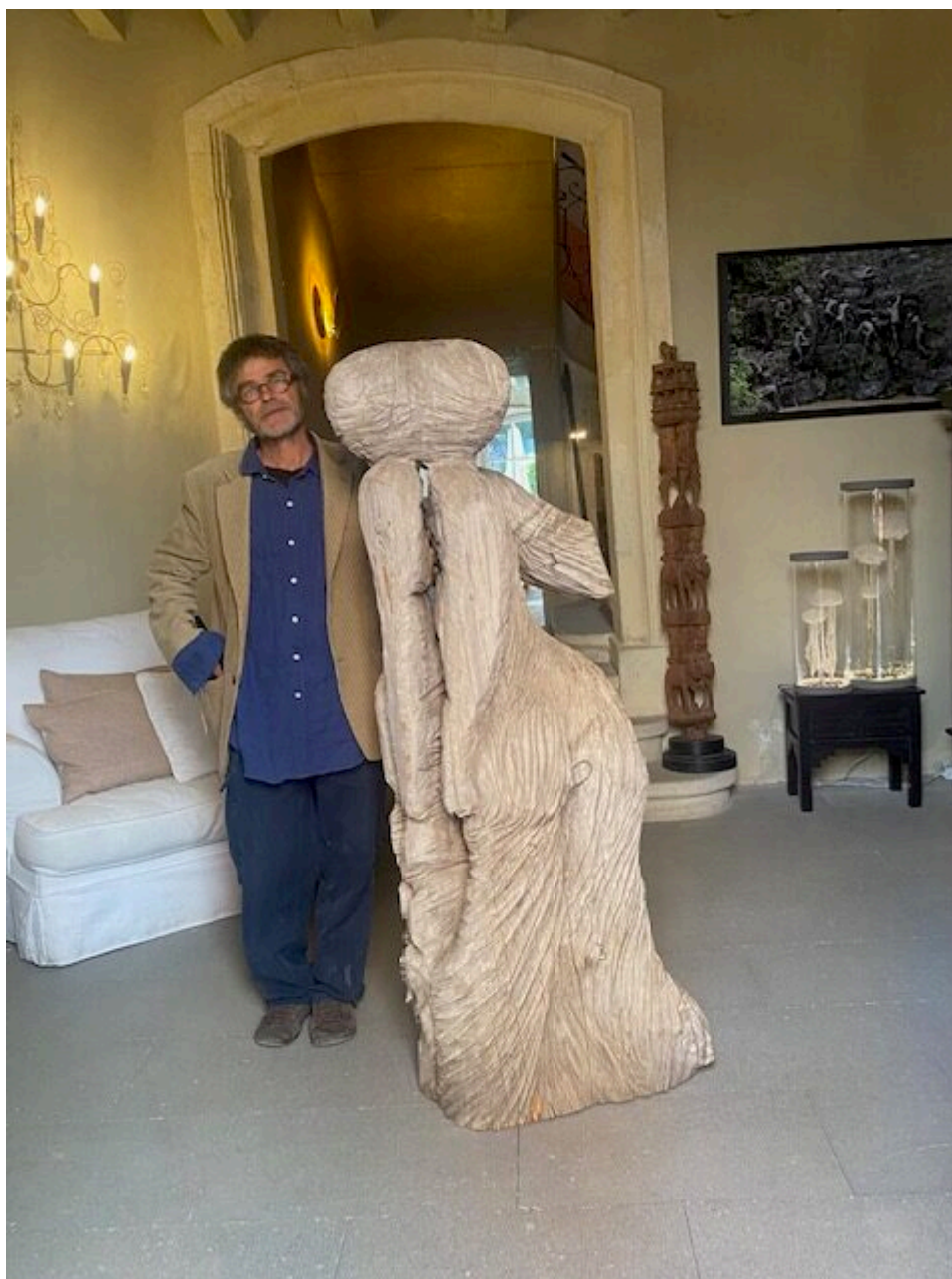
Le baiser, Marc Nucera, Copyright MMH