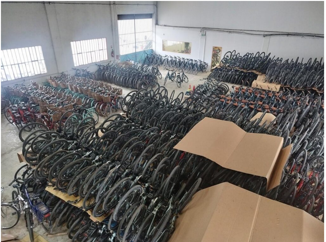
Le site sur Carpentras a 2 000 vélos en stock

Le grand second concept de location concerne les cyclotouristes désirant faire un itinéraire à vélo comme la via Venaissia ou encore la via Rhôna, le Calavon, sans oublier le mythique Mont Ventoux. « Nous faisons de la livraison de vélos pour nos clients. Par exemple, pour un une personne ou un groupe désirant faire Valence-Avignon en vélo, nous lui livrons le vélo à la sortie de son train en gare TGV avec tous les accessoires nécessaires comme les sacoches. Nous récupérons les vélos à l'arrivée avec un service complet. »