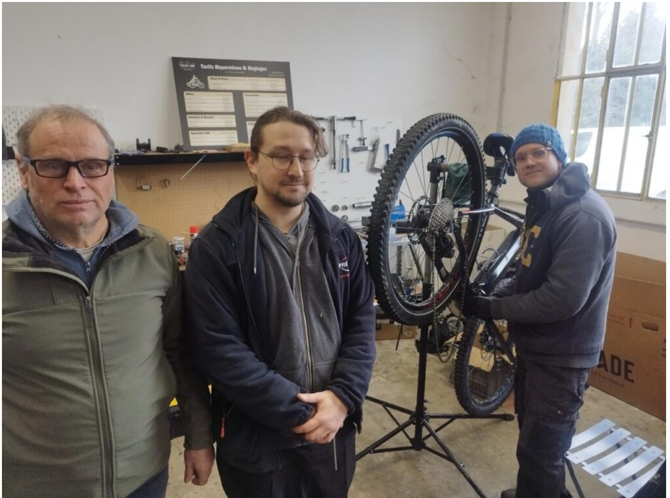
Deux mécaniciens assurent l'entretien des vélos