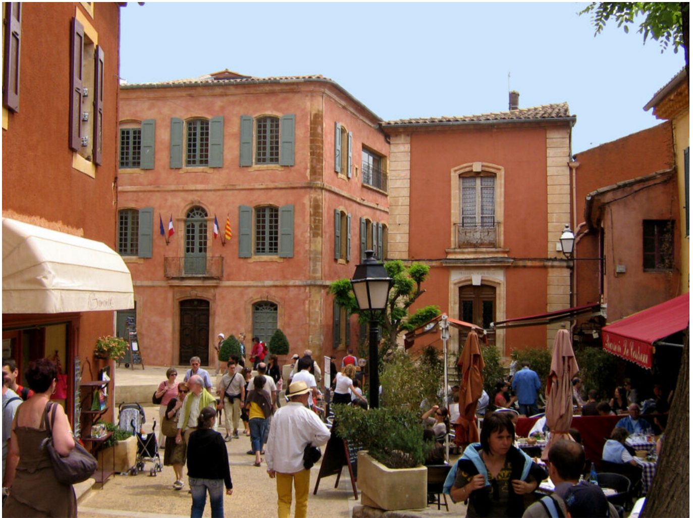
TARDIEU N - VPA

A l'approche des vacances de Toussaint, la pénurie de carburant semble impacter cette période de congés particulièrement propice aux réservations de dernière minute. C'est ce que constate une étude que vient de réaliser le site Particulier à particulier . Une tendance qui devrait fortement impacter le Vaucluse.