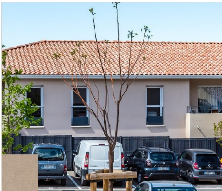
Résidence Les Amandiers

Grand Delta Habitat a inauguré, le 20 septembre dernier, la résidence des Amandiers qui accueille 20 logements et se situe à proximité du centre-ville de Robion. La résidence locative Les Amandiers s'épanouit 525, avenue Aristide Briand. Elle est composée de 20 logements allant du T2 au T4. L'ensemble se monte à plus de 2,680M€.