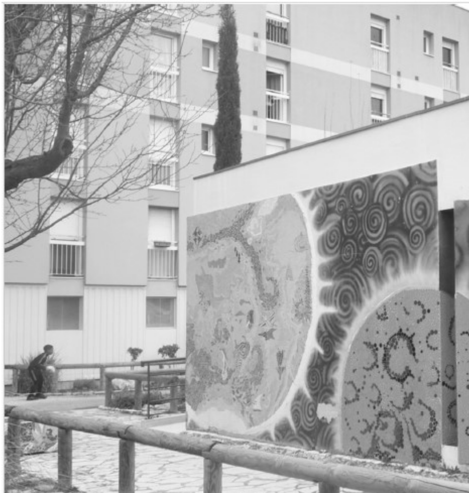
Quartier Grange d'Orel à Avignon, Copyright Sylvie Villeger

réhabilitation concerne particulièrement l'amélioration de l'acoustique de la salle polyvalente pour en faire un espace mieux adapté aux activités culturelles, sportives et sociales.