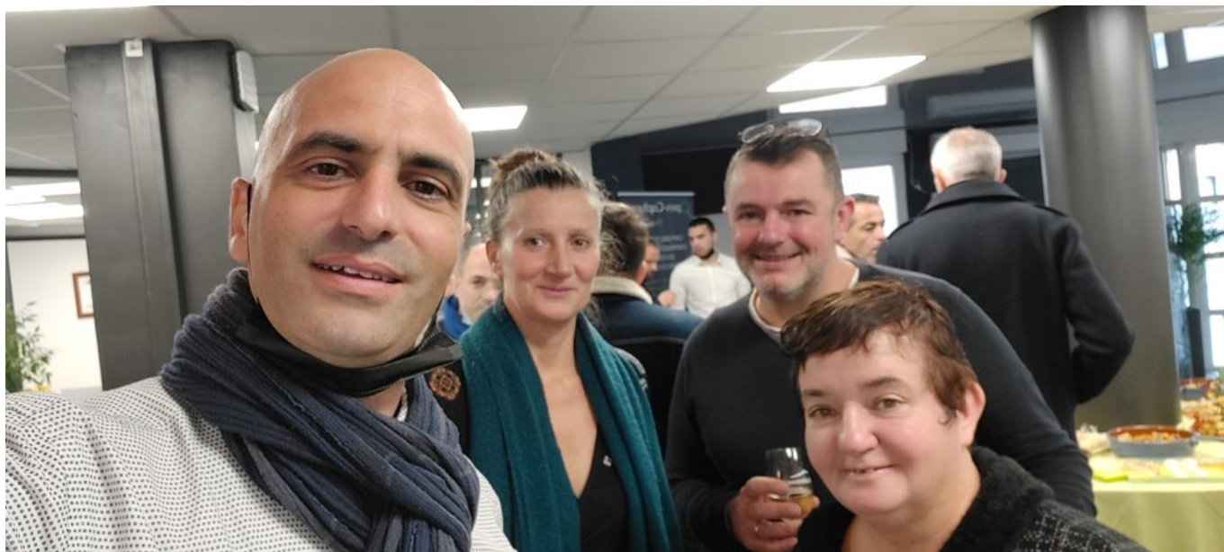
Une inauguration sous le signe de la convivialité.