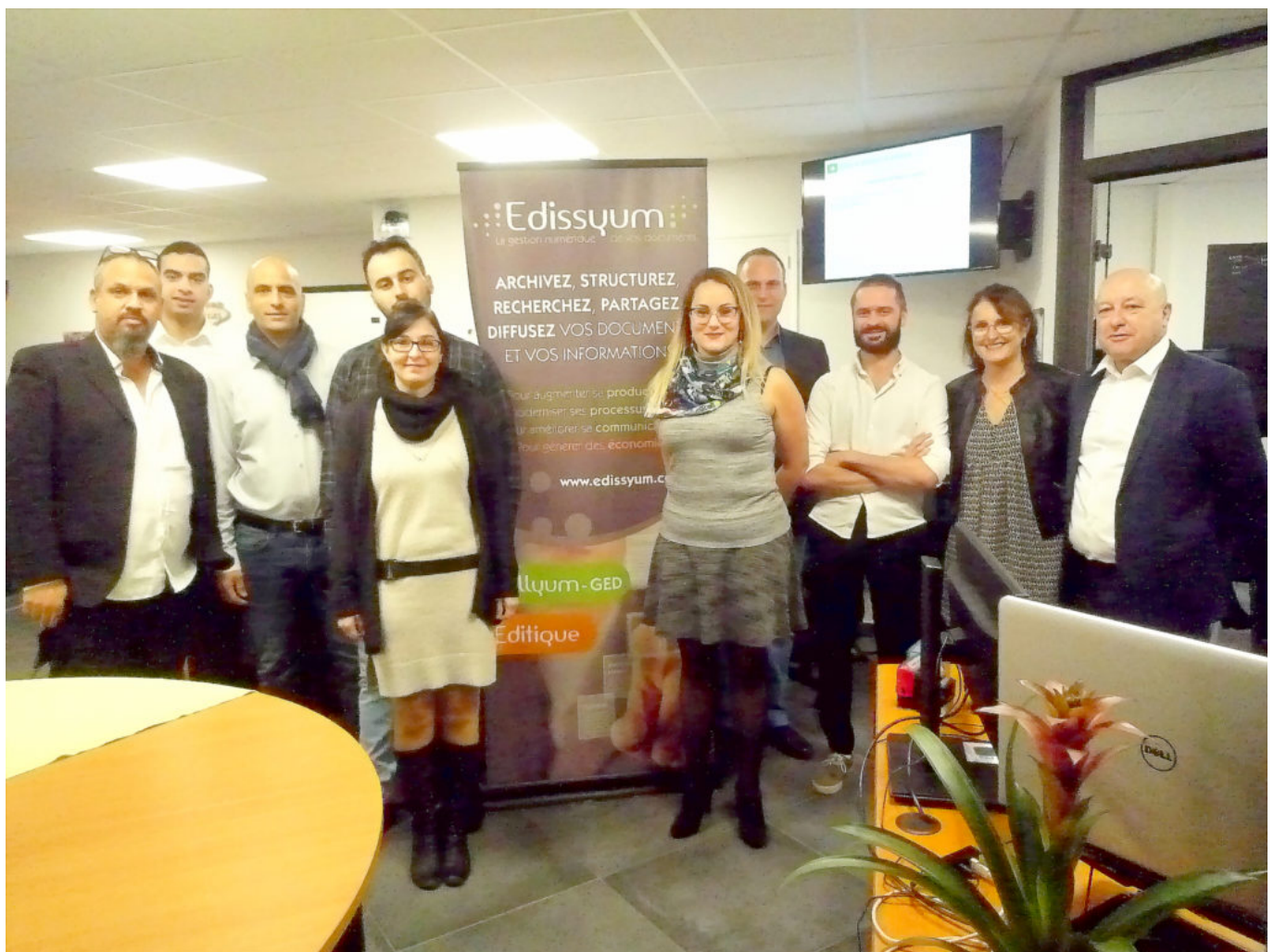
Les collaborateurs ont déjà pris leurs quartiers.

Plus d'informations, cliquez ici . Retour en images de l'inauguration :