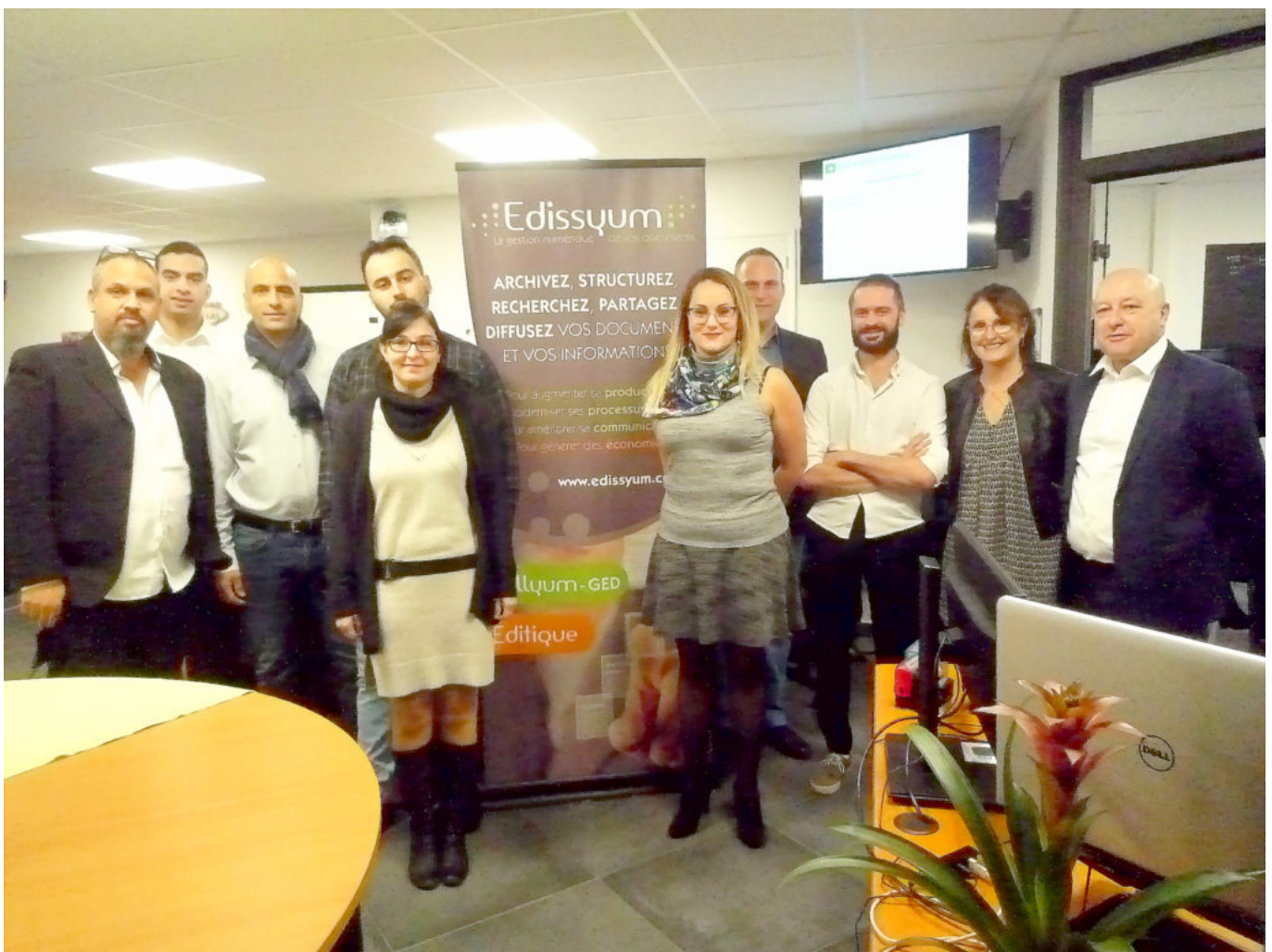
Les collaborateurs ont déjà pris leurs quartiers.

Plus d'informations, cliquez ici . Retour en images de l'inauguration :