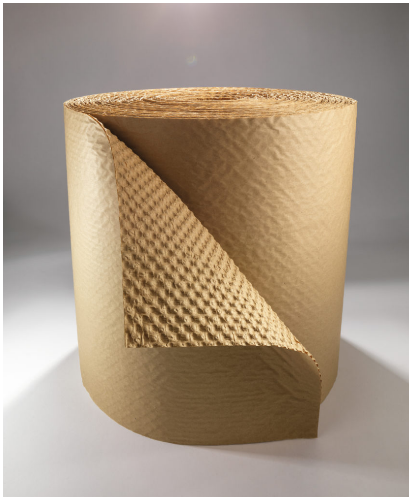
Papier bulle recyclé

bulle plastique. Le papier bulle a d'ailleurs reçu l'Oscar de l'Emballage 2021 pour son caractère innovant au bénéfice de l'environnement.