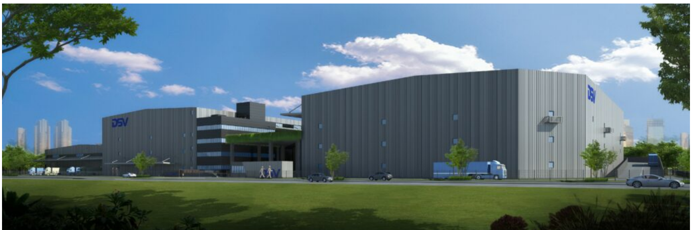
Modélisation des bâtiments logistiques construit par GSE pour DSV Logistics.