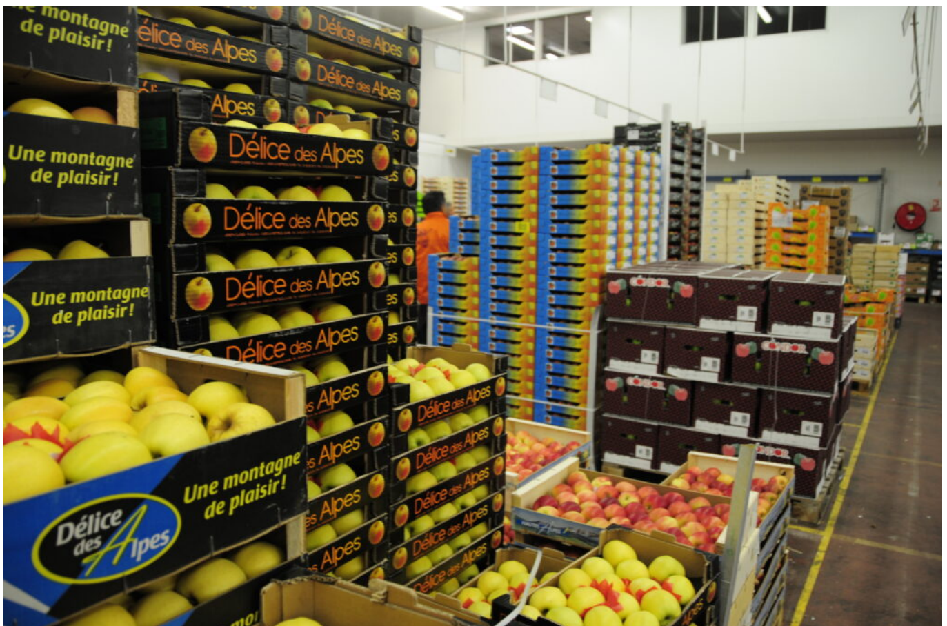
Le MIN d'Avignon.