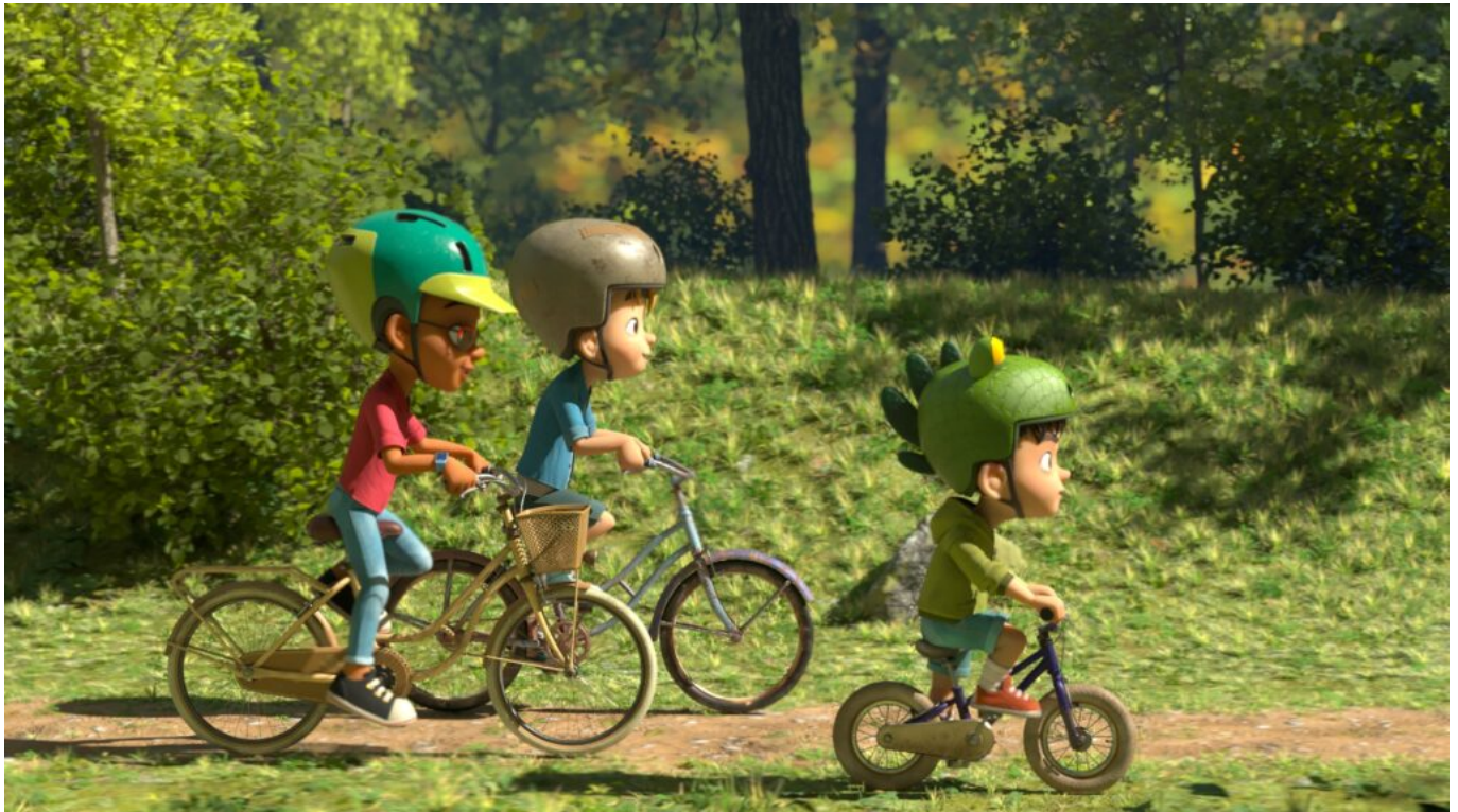
Partie de Campagne

Plus qu'un soutien, Loïc Etienne accompagnera le studio Station animation dans toutes les démarches jusqu'au choix des locaux. Installé dans des locaux de 150 mètres carré au cœur du centre-ville, la société dispose de tous les aménagements pour accueillir la quinzaine de modelleurs, 'textureurs' et quelques 'setuiseurs' qui travaillent au quotidien pour le studio.