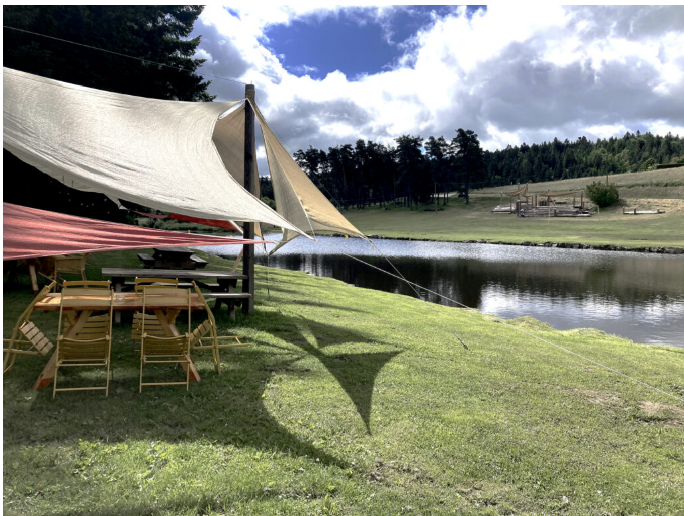
Au bord du plan d'eau alimenté par le Lignon.