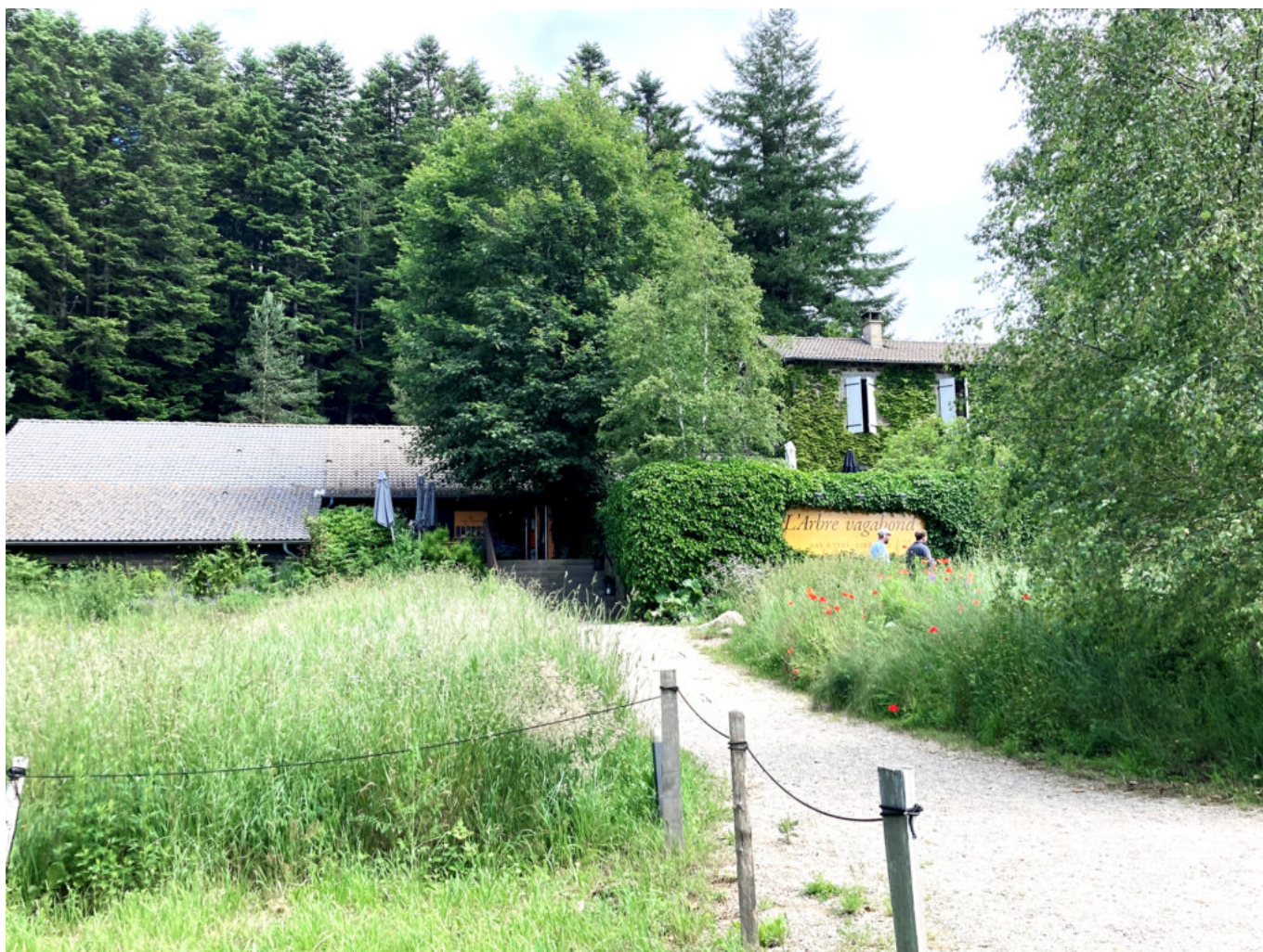
L'Arbre Vagabond accueille aussi le festival des Lectures sous l'arbre.