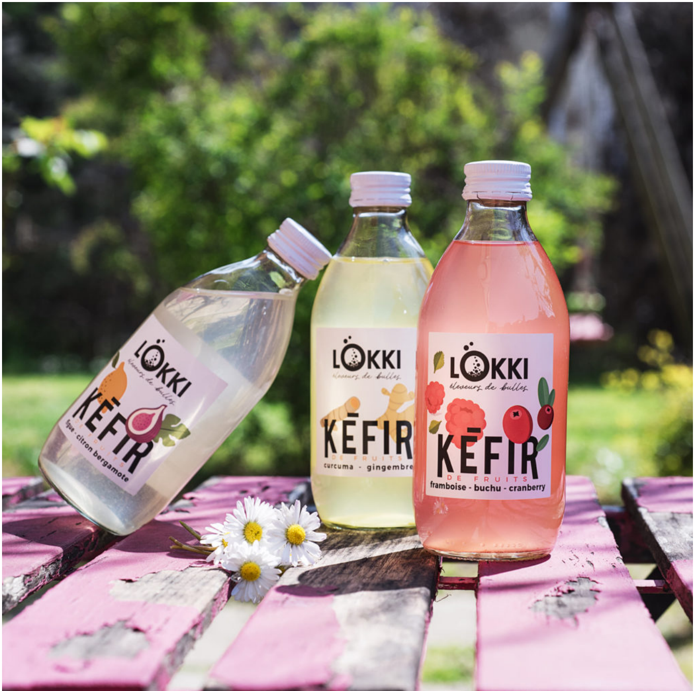
Trois teintes de kéfirs. Crédit photo : Laura Jonneskindt