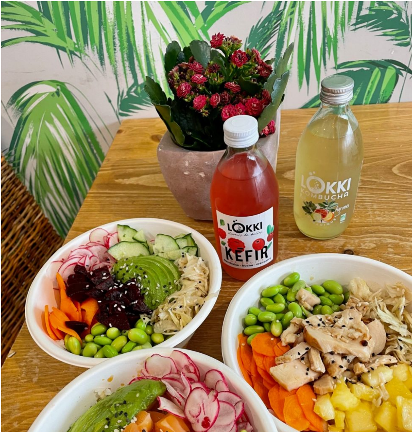
On en salive...