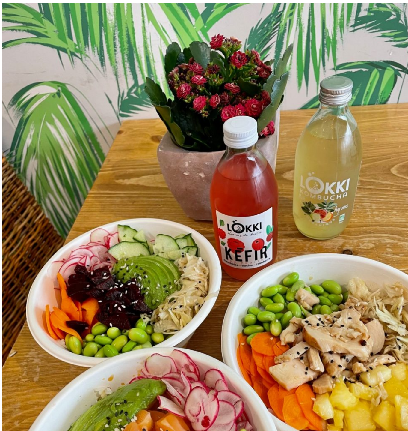
On en salive...