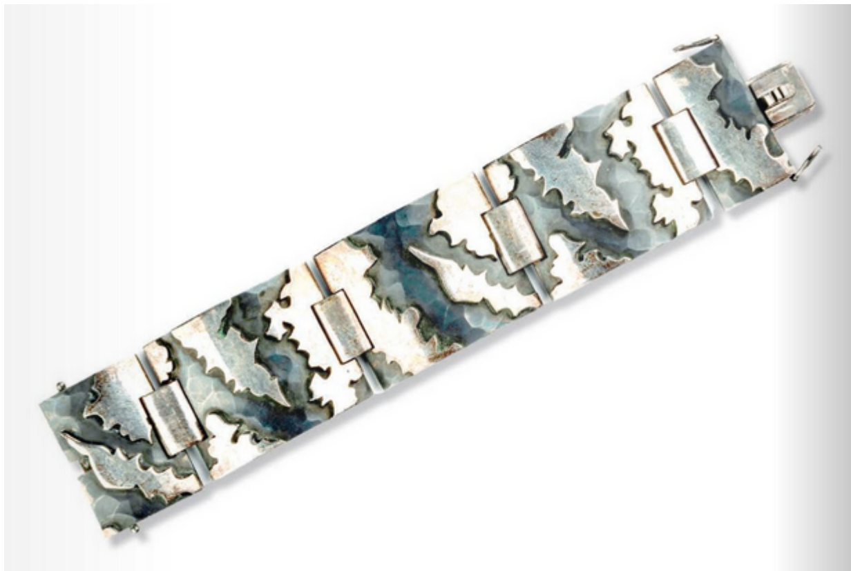
Bracelet Jean Després lot 334