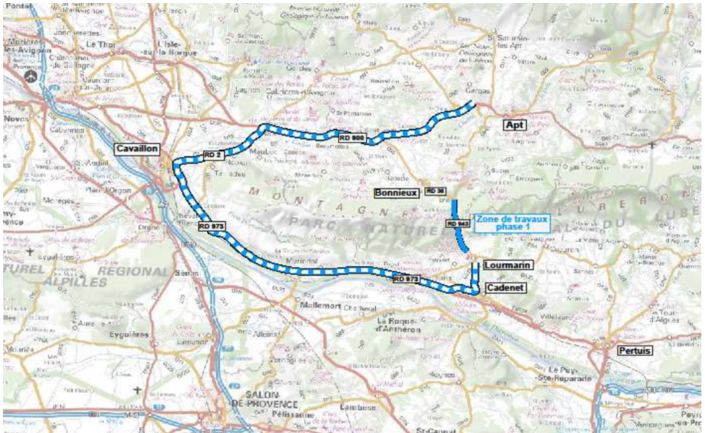
Déviation lors des travaux de la phase 1, de la RD 943