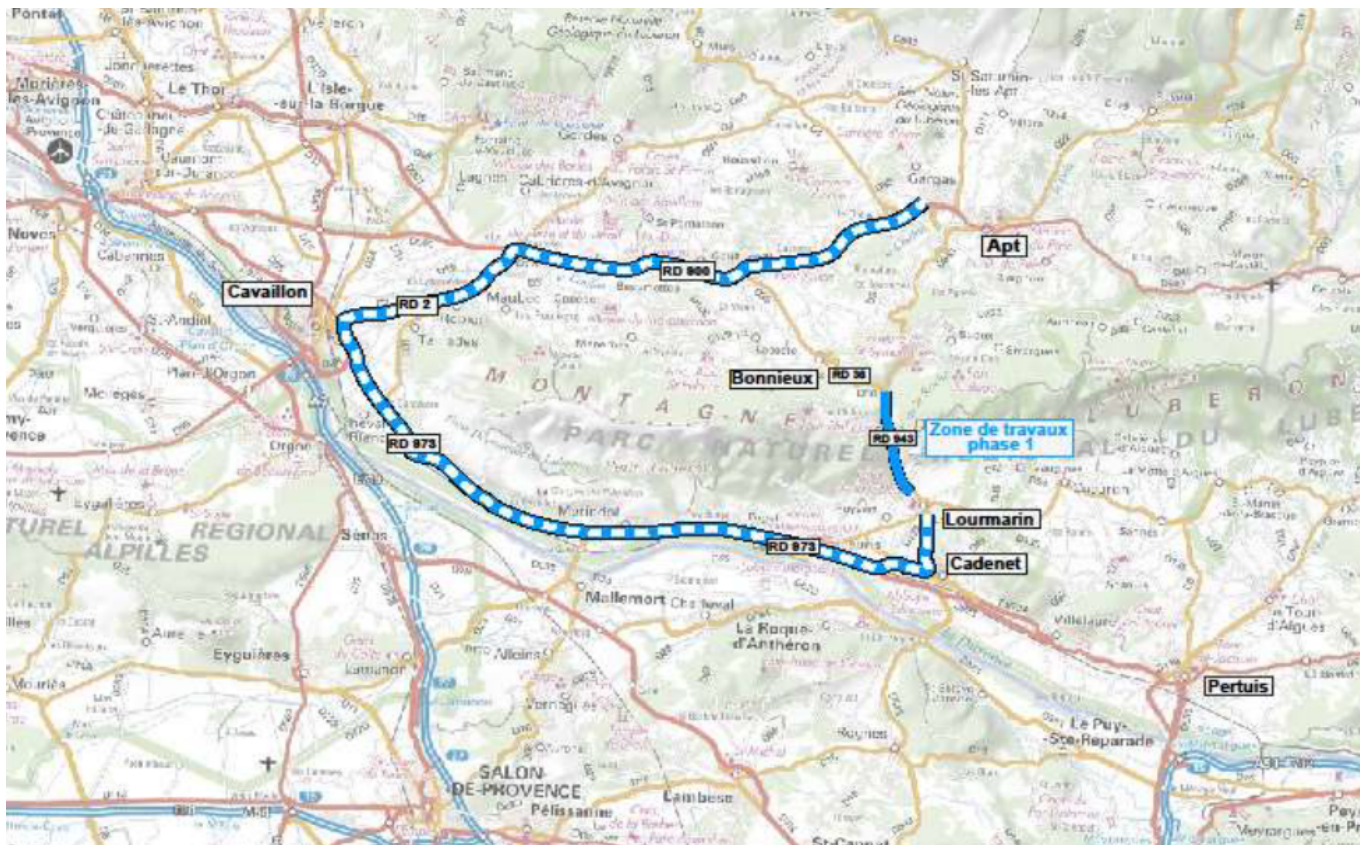
Déviation lors des travaux de la phase 1, de la RD 943