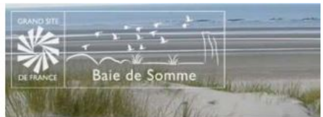
variante blanc sur fond transparent