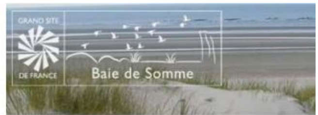
variante blanc sur fond transparent