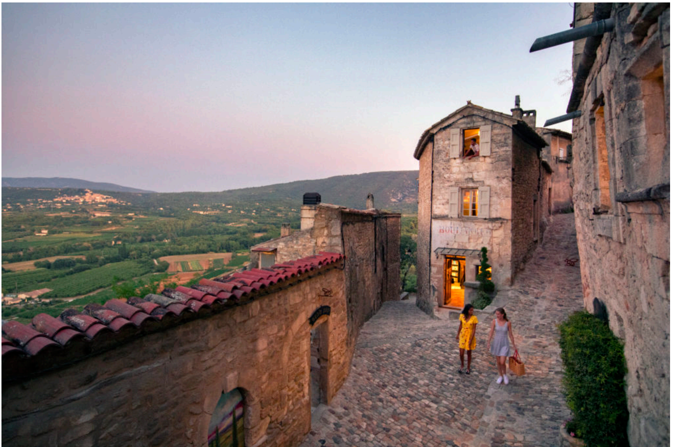
SCAD Lacoste, été 2019, rue du Four.