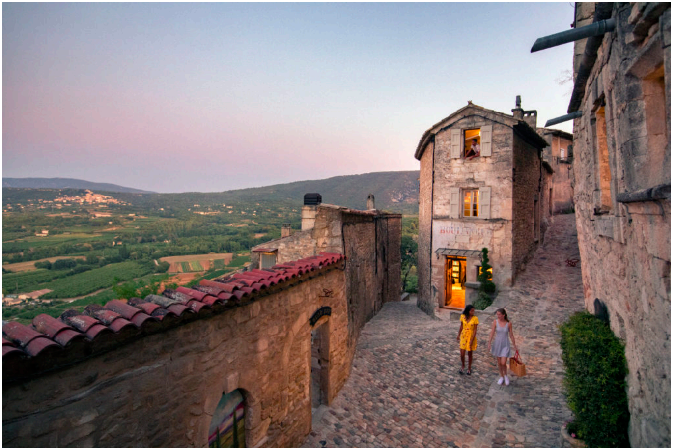
SCAD Lacoste, été 2019, rue du Four.