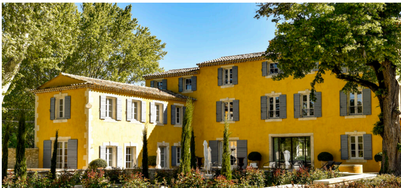
Domaine du Fortin Festival luxury guest house