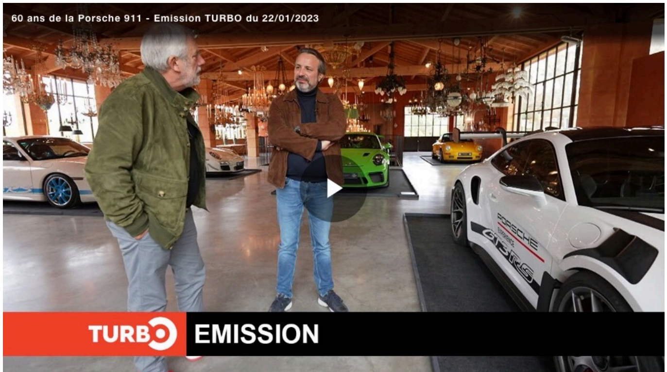
60 ans de la Porsche 911 - Emission TURBO du 22/01/2023