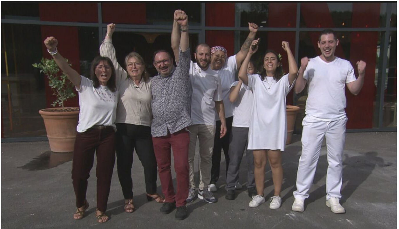
L'équipe de la boulangerie Meinado.