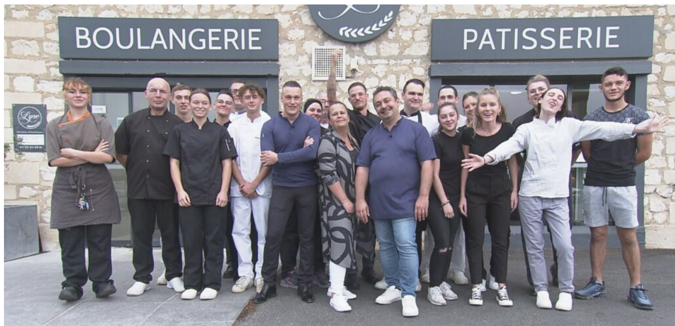
L'équipe de la boulangerie Lyse.