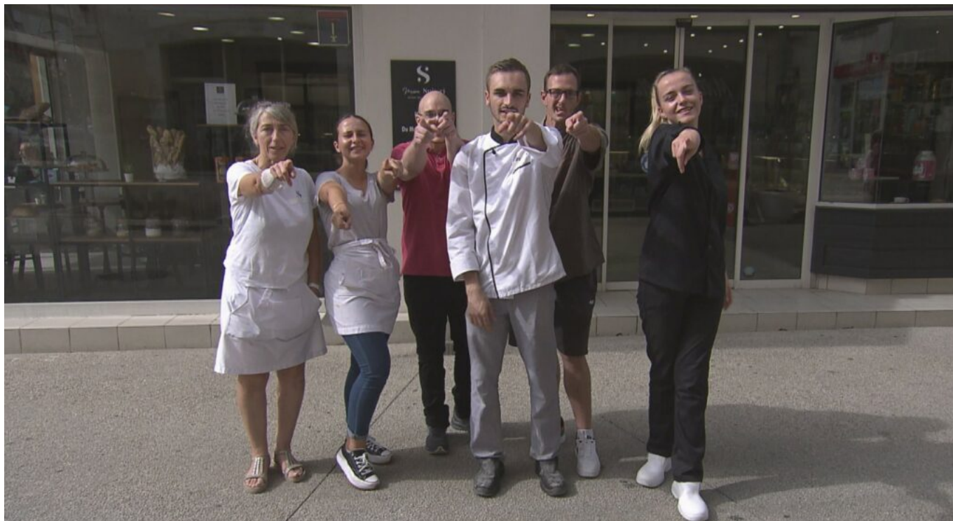
L'équipe de la boulangerie Spiteri.

'La meilleure boulangerie de France' en région Paca. Tous les soirs à 18h35 sur M6. Du lundi 23 au vendredi 27 janvier.