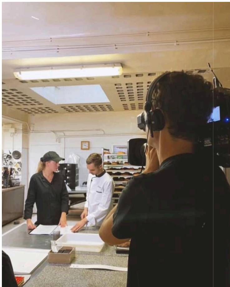
Tournage dans la boulangerie Spiteri à Tarascon.