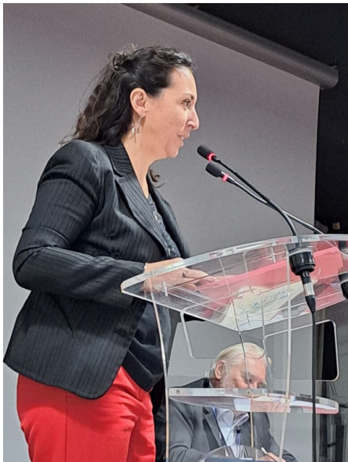
Violaine Démaret, préfète de Vaucluse

vie, mais en mieux. » Applaudissements des maires, parlementaires, personnalités civiles et militaires réunis dans la Salle du Château d'Eau, avant de faire le tour des 40 stands d'exposants.