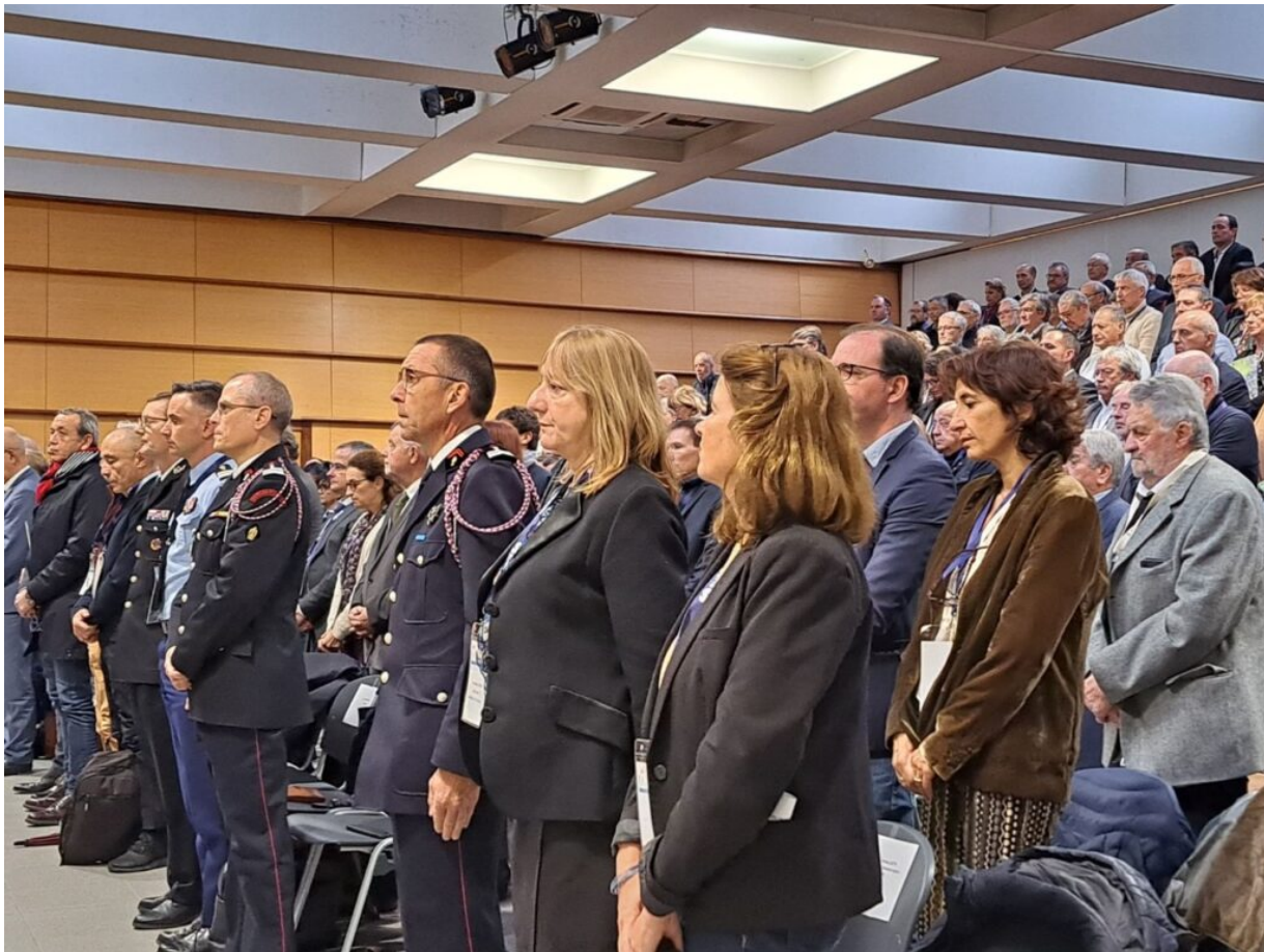
Une minute de silence en hommage aux élus décédés en 2023.