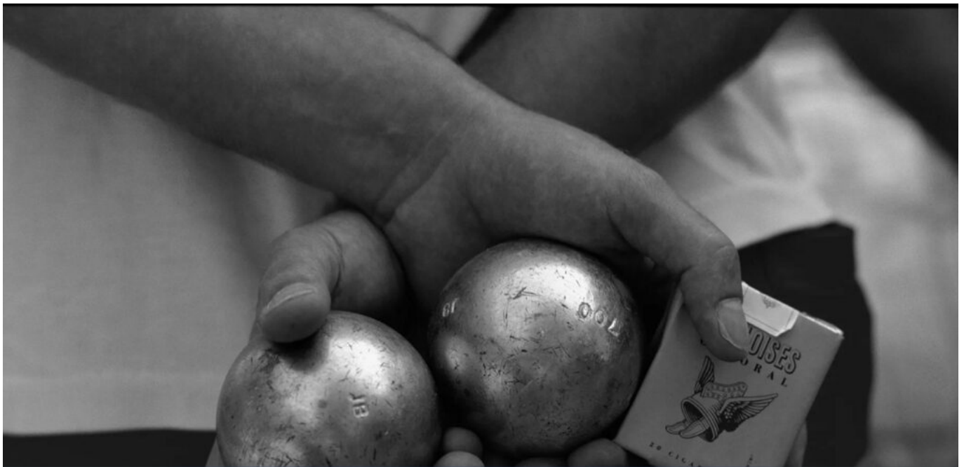
Dr Hans Silvester