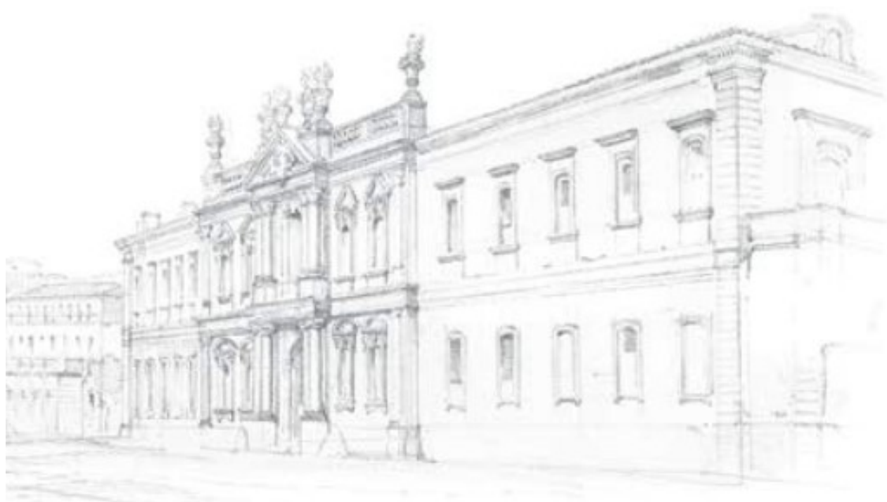
↑ Bonaventure Laurens, Façade de l'hôtel-Dieu de Carpentras, crayon, vers 1849

par l'ouverture de la bibliothèque musée dans son nouvel écrin, accueillant 42 989 visiteurs sur ses 236 jours d'activités, soit 4 777 personnes par mois. Egalement, 159 groupes, soit 2 741 personnes ont visité les collections permanentes et temporaires dont 116 en visites guidées. La bibliothèque accueille aujourd'hui près de 7 000 lecteurs actifs et plus de 130 000 usagers avaient franchi le seuil de la bibliothèque multimédia en 2023.