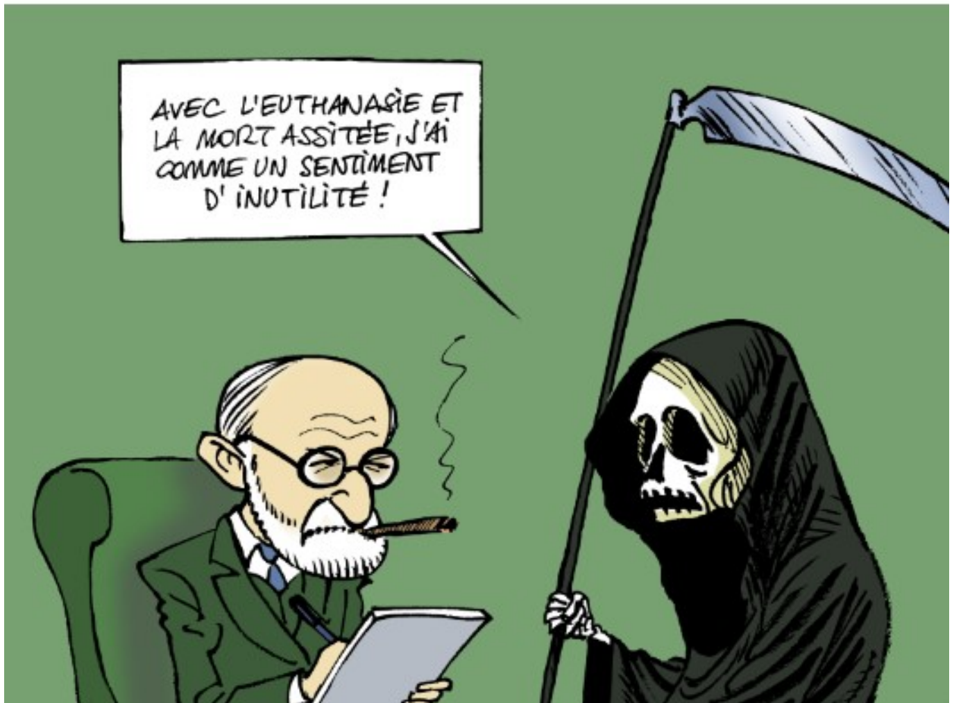
Freud et la Mort