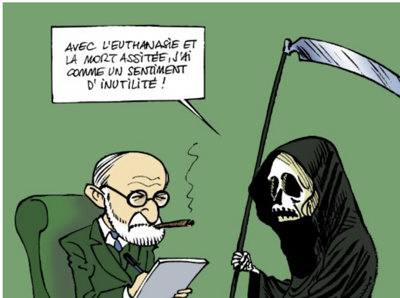
Freud et la Mort