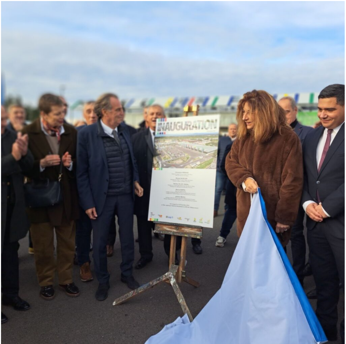
Renaud Muselier et Martine Vassal lors de l'inauguration.

Il faut savoir qu'après cette 1 re étape, le programme du Pôle Logistique va s'enrichir dans quelques mois d'un nouveau carreau des producteurs avec des entrepôts adaptés aux attentes environnementales des consommateurs. Il sera, lui aussi, le moteur de la transition énergétique avec une « Centrale de production photovoltaïque » de 4,2GW pour valoriser les produits locaux et bio et apporter une valeur