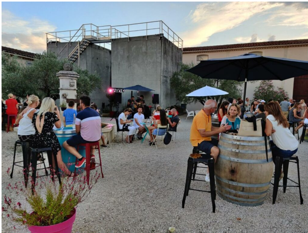
Le Domaine Fontaine du Clos