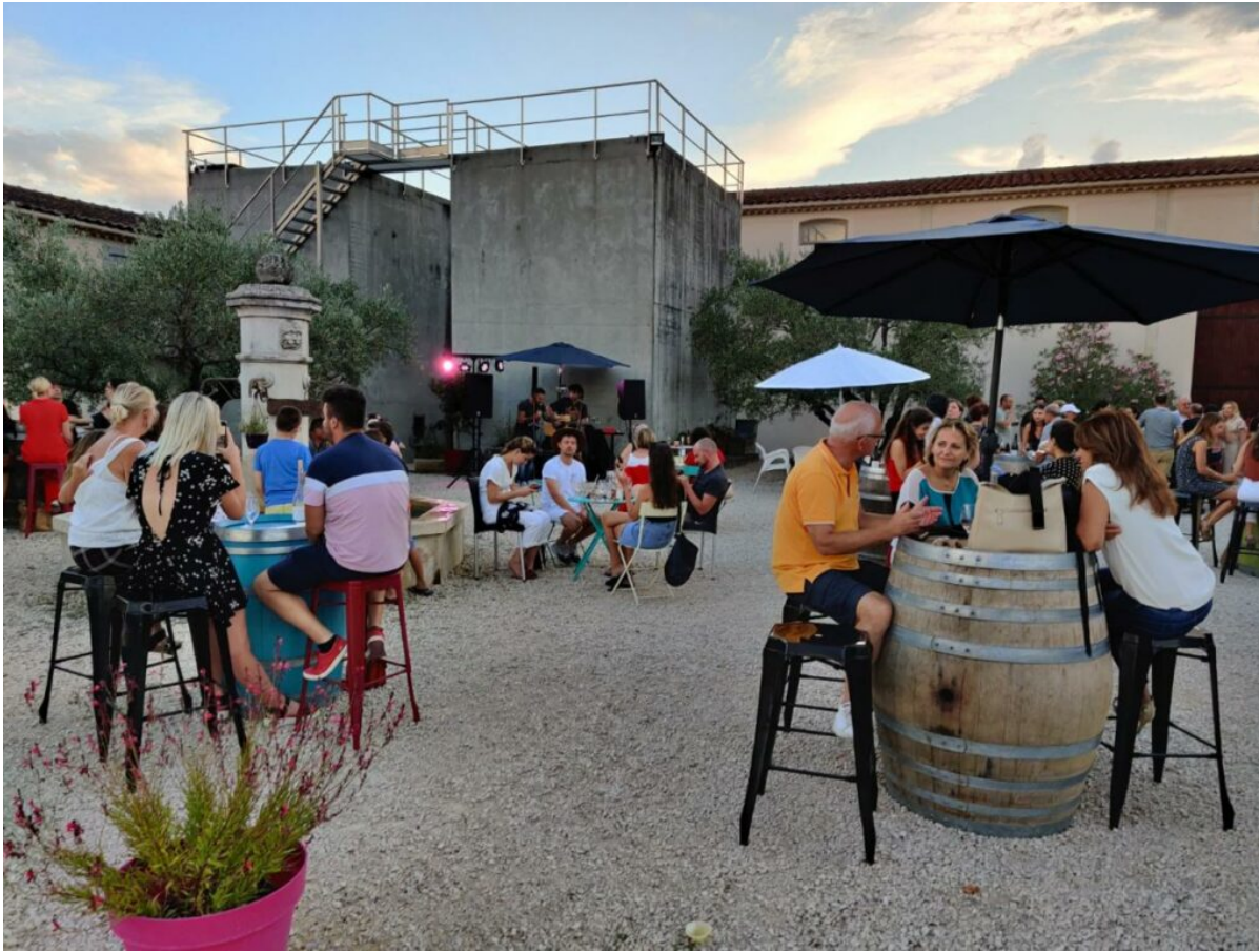
Le Domaine Fontaine du Clos