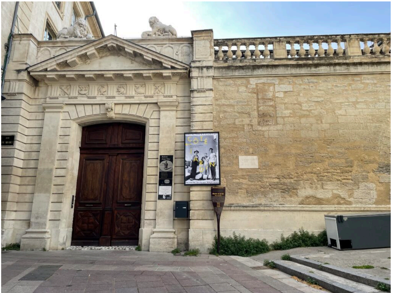
La Maison Jean Vilar réouvre au public

du 22 août 2022 au 30 avril 2023 : Du mardi au samedi de 14h à 18h. Entrée : Le billet d'entrée de l'exposition Infiniment - Maria Casarès, Gérard Philipe - une évocation donne l'accès à toutes les expositions de la Maison Jean Vilar. À partir du 7 juillet 2022 : L'œil présent - Photographier le Festival d'Avignon au risque de l'instant suspendu. Tous les soirs - Jean Vilar, Notes de service, TNP 1951 - 1963 Plein tarif : 6€ Tarif réduit : 3€ Entrée gratuite pour les moins de 12 ans. Tout le programme de l'été ici . Maison Jean Vilar. Place de l'Horloge, Montée Paul Puaux. 8, rue Mons à Avignon. 04 90 86 59 64.