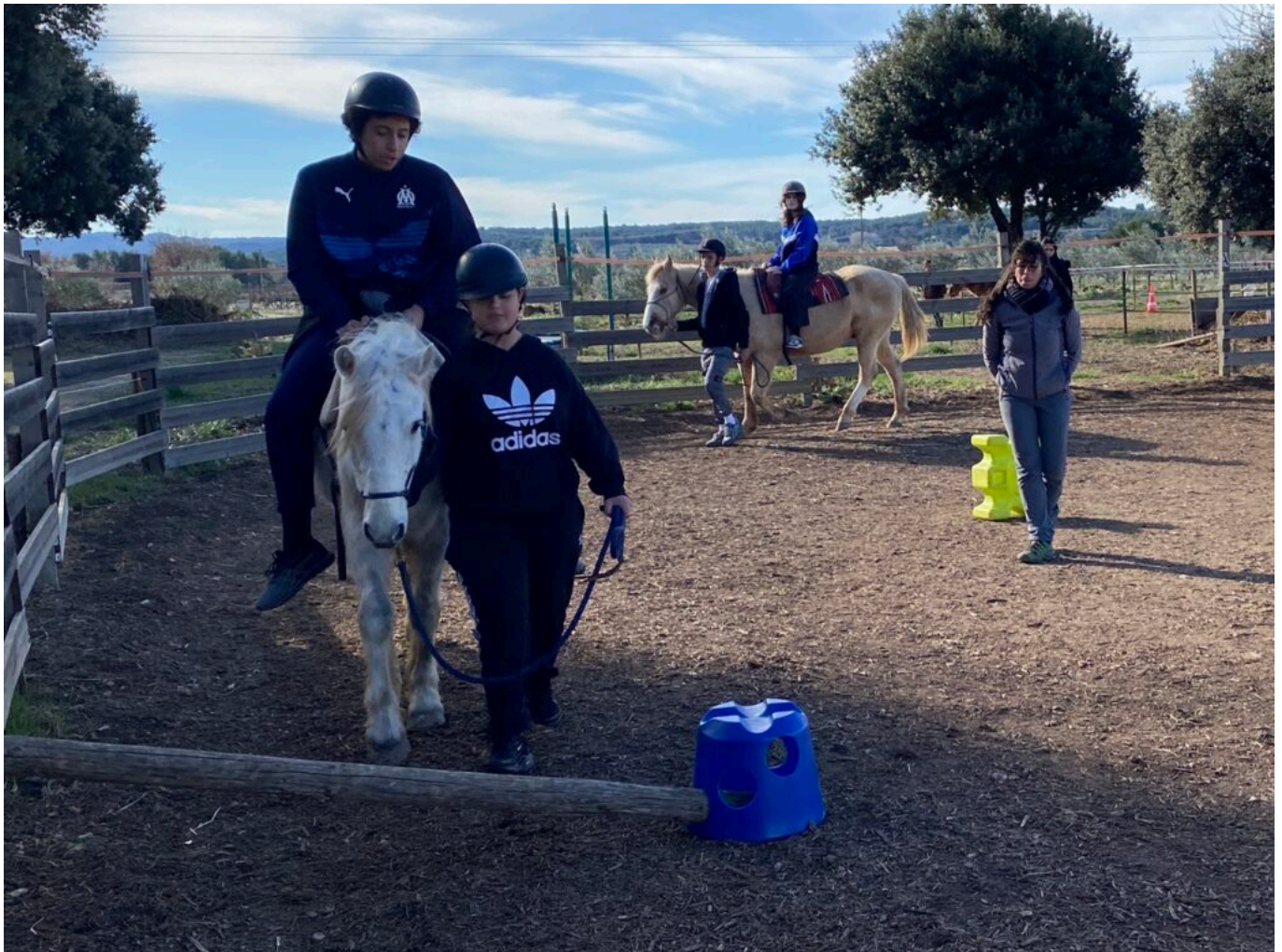
Les jeunes du Micro collège en séance d'équihomologie au Lucky Horse à Mazan.