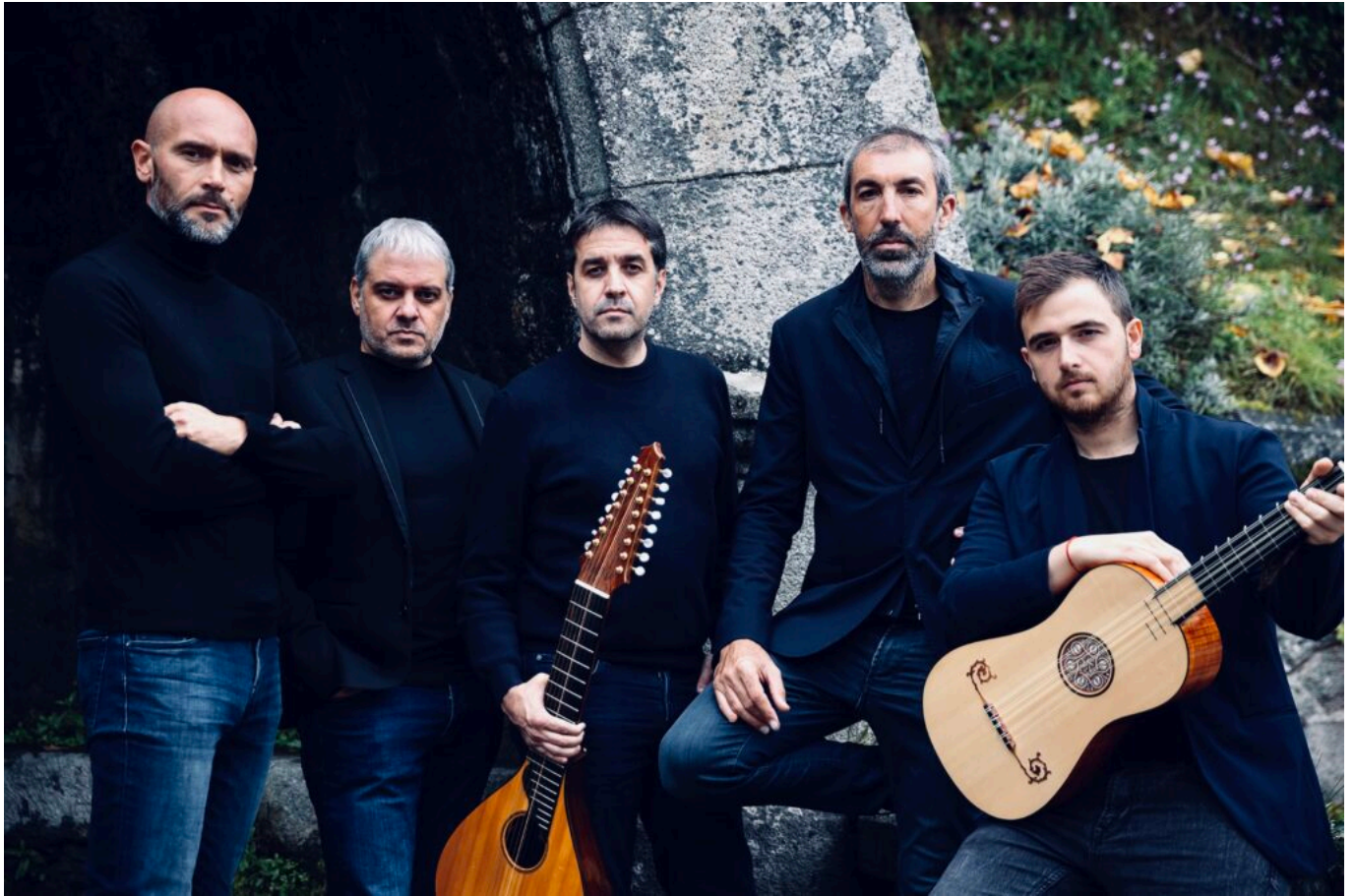
I Messageri