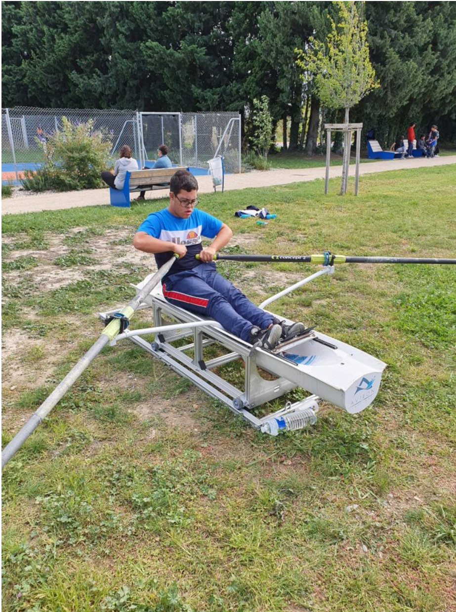
Prototypé de bateau solo développé par l'entreprise ATG Technologies