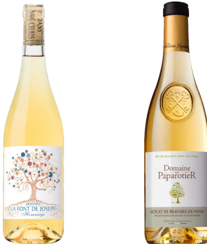
Muscat de Beaumes-de-Venise AOP, domaine la Font de Joseph - Hommage - 2021 (à gauche) et Muscat de Beaumes-de-Venise AOP, domaine du Paparotier (à droite)

des cépages muscats venus de 19 pays. Sur les 56 médailles décernées, Rhonéa récolte deux médailles d'or et intègre le Top 10 des meilleurs muscats du monde. A noter que sur les trois vins français qui intègrent le Top 10, deux sont produits par Rhonéa.