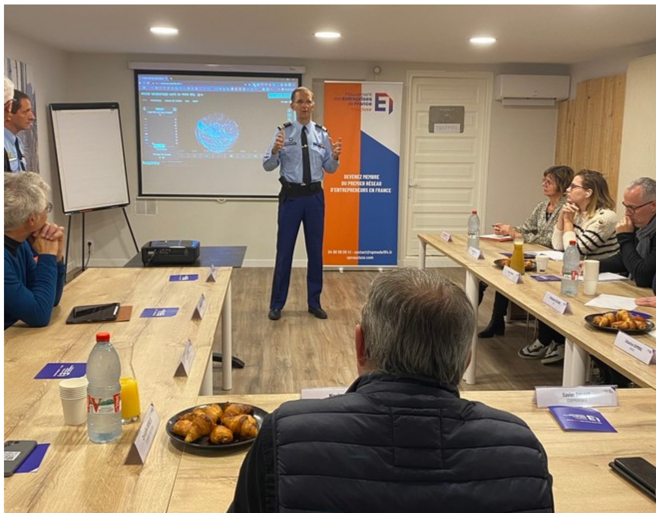
Sensibilisation à la cybersécurité des adhérents du Medef 84 avec la gendarmerie de Vaucluse.