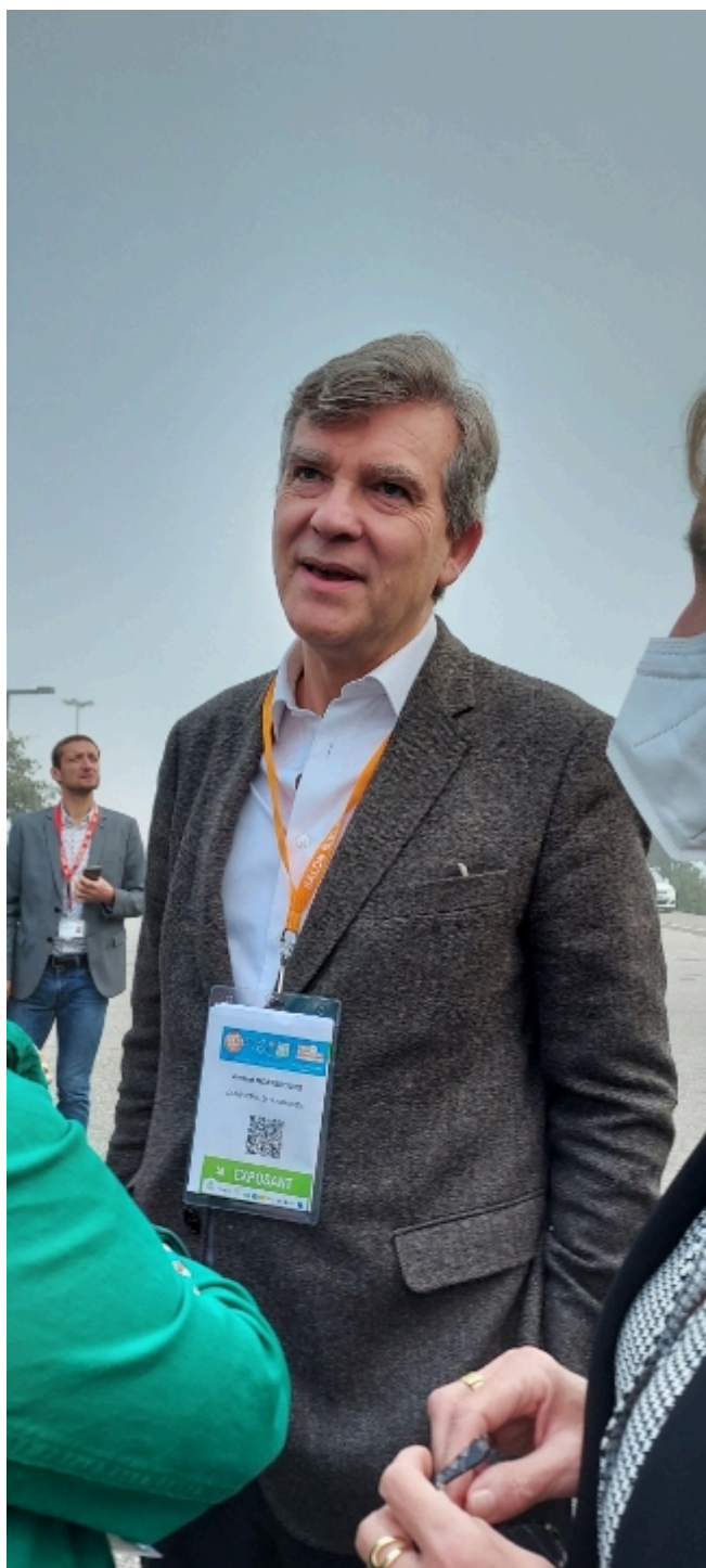
Arnaud Montebourg