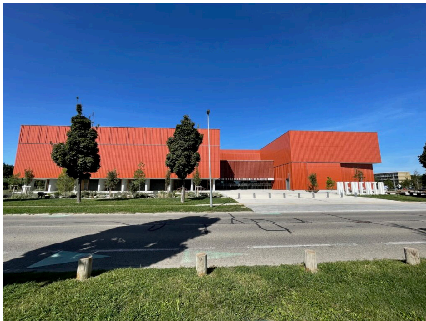
Memento Copyright MMH

Avignon. Dans les couloirs silencieux du Palais des papes, là où les échos du XIV e siècle résonnent encore sous les voûtes gothiques, un immense secret sommeille depuis plus de 145 ans : 28 kilomètres de mémoire, d'encre et de papier. Un trésor discret, fait de parchemins médiévaux, de cartes anciennes, d'actes notariés, de jugements récents, de récits oubliés et de dessins minutieux. Nous sommes aux Archives départementales . Ces documents, témoins de la vie de 151 communes vauclusiennes, vont entamer une grande traversée. Une migration inédite, délicate et majestueuse, vers un nouveau sanctuaire : Memento , le tout nouveau Pôle des patrimoines de Vaucluse.