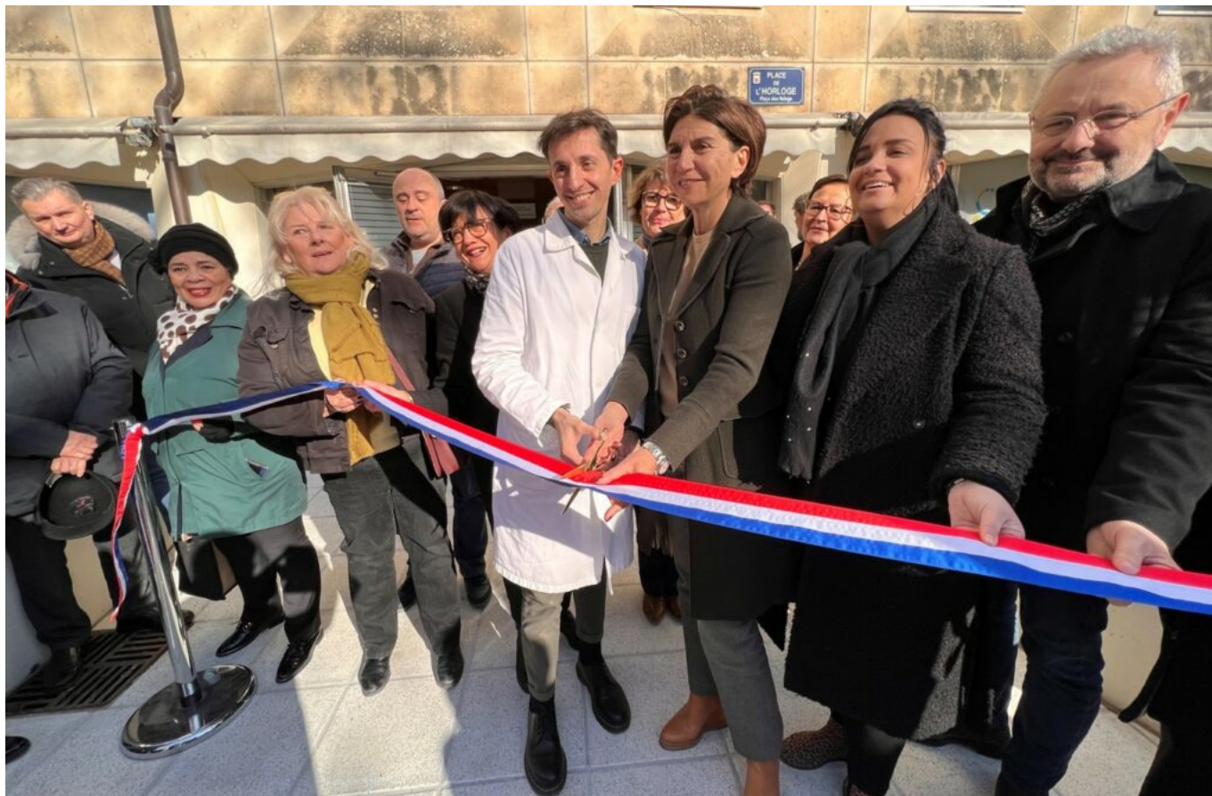
Inauguration de la maison de santé à Avignon en février dernier.

« Les Vauclusiens ont envie de vieillir chez eux. »