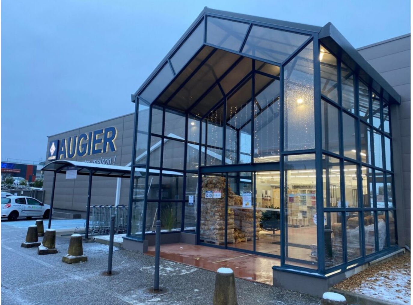
Image d'archives des établissements Benjamin Long.

La boutique Augier, à Vaison-la-Romaine, aujourd'hui, au 950 Route de Nyons .