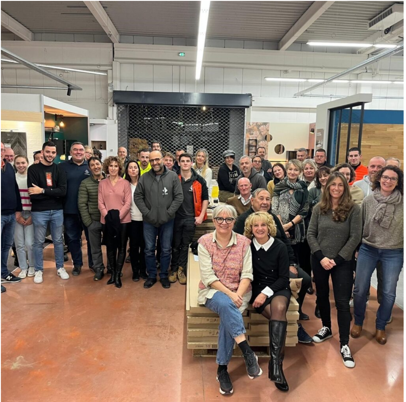
L'équipe Augier.