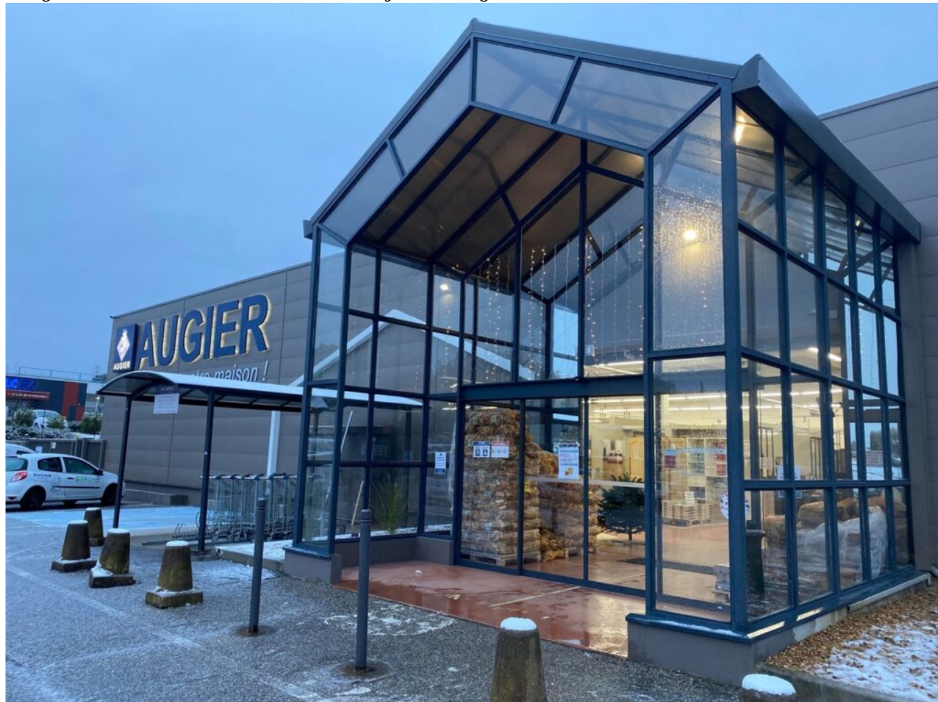
Image d'archives des établissements Benjamin Long.

La boutique Augier, à Vaison-la-Romaine, aujourd'hui, au 950 Route de Nyons .