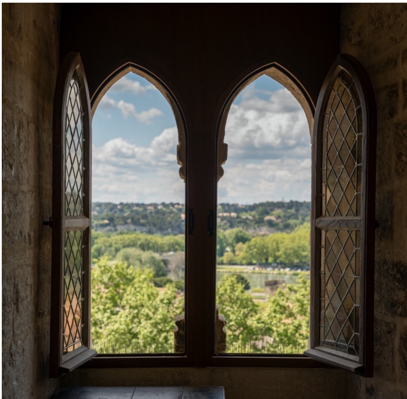
Palais des Papes