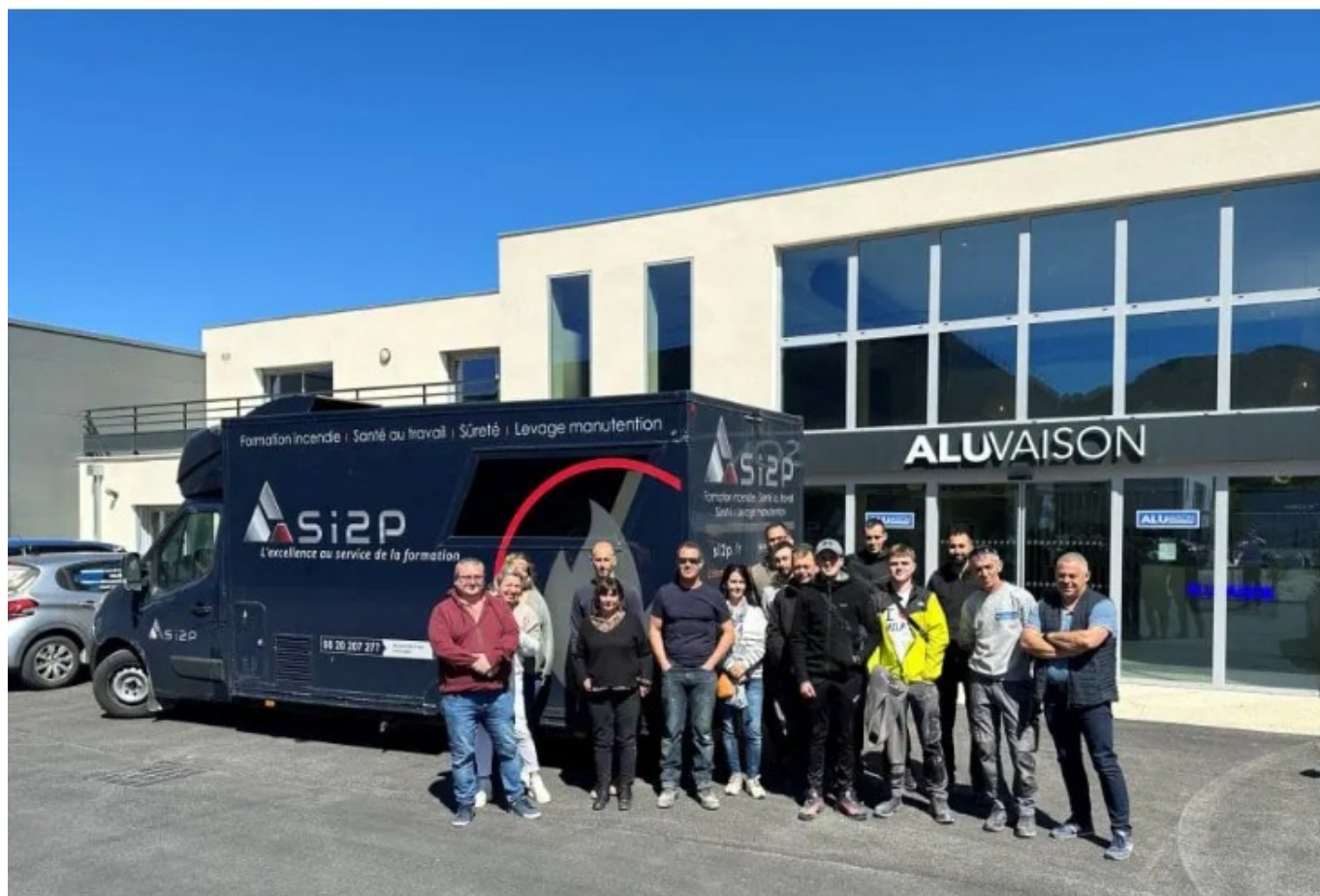
Alu Vaison

«Puis nous sommes passés de 8 à 19 salariés et de 1,5M€ à plus de 4M€ en 2024. Nous avons construit une nouvelle usine de fabrication, puis nous avons été frappés de plein fouet par la pandémie de Covid 19 le 17 mars 2020. Les premières et dernières nuits ont été difficiles parce qu'on ne savait pas où l'on allait. Mais avec le recul, la crise du Covid s'est révélée être un bon booster, nous permettant de nous développer, même si nous devons faire face au problème d'approvisionnement et à la pénurie d'acier.»