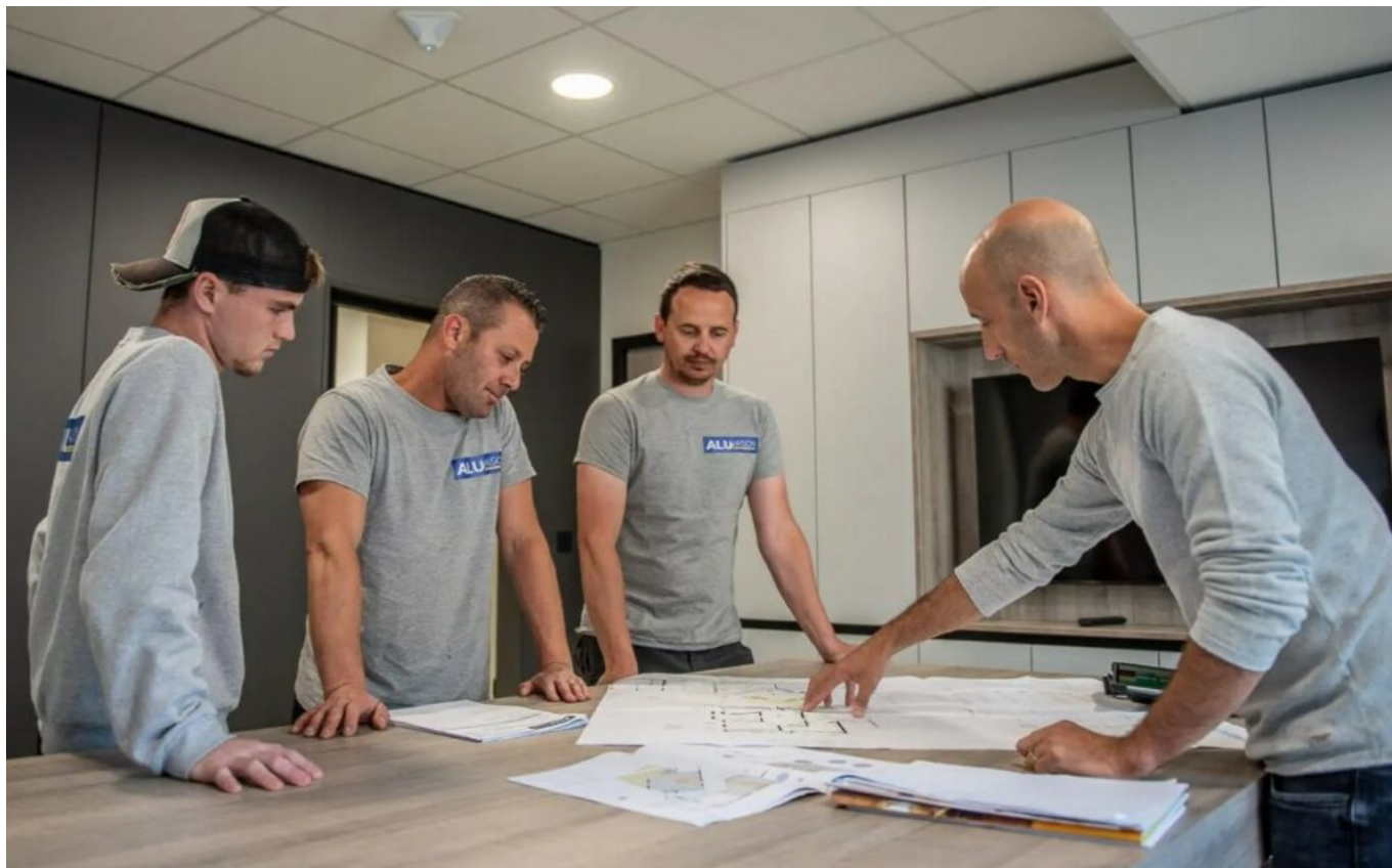
Une des équipes d'Alu Vaison