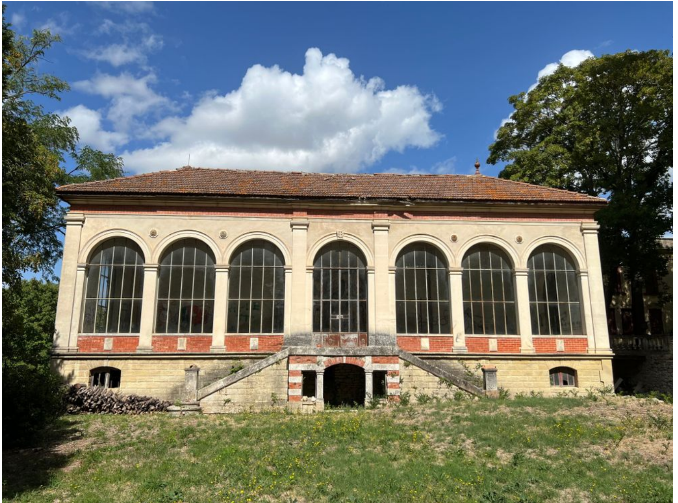
L'orangerie du Château de Thézan.

Mission Patrimoine en a sélectionné 100, dont un en Vaucluse : l'orangerie du Château de Thézan à Saint-Didier.