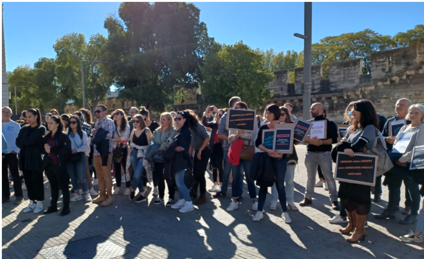
Près de 100 personnes se sont mobilisées pour ne plus être les oubliées du Ségur