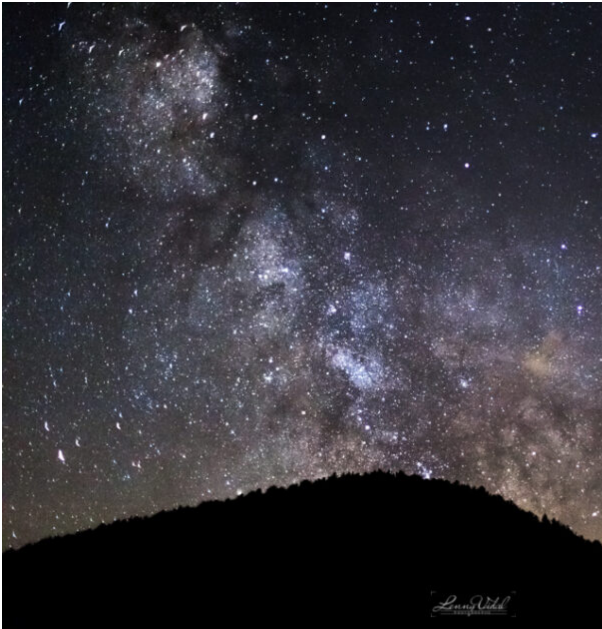
Saint-Trinit, les Etoiles dans l'objectif