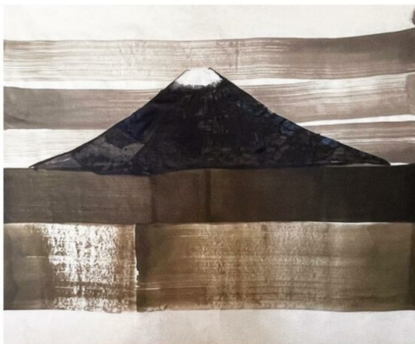
Le mont Fuji de Louise Cara - papier coréen 215 x 150 cm - encre japonaise, encres couleurs, pastel - 2025

Ouverture au public de 14h à 20h sauf les lundis