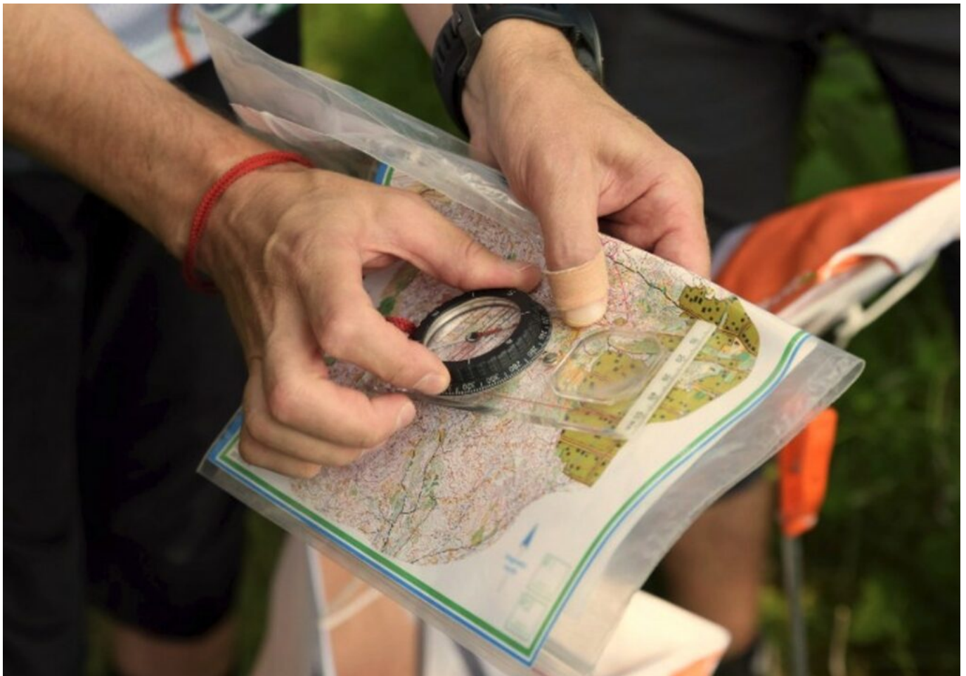
Course d'orientation