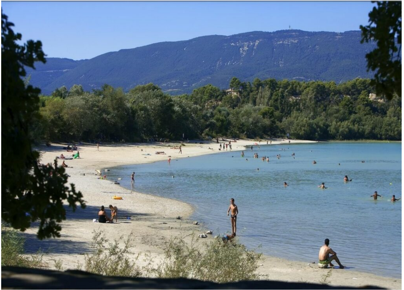
Etang de la Bonde à Cabrières d'Aigues