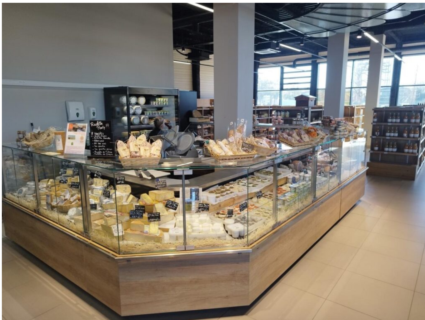
Un stand à la coupe est proposé en charcuterie et en fromage