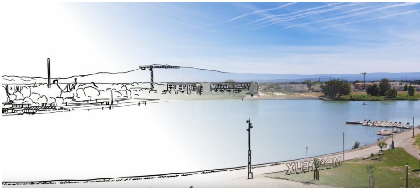
La zone de Beaulieu.

« Nous avons décidé de créer de la richesse. C'est ce que nous avons fait avec Beaulieu. »