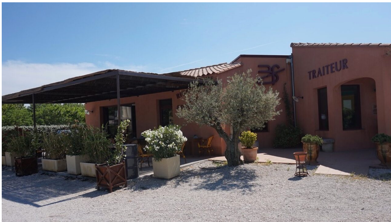
Le traiteur possède également un restaurant sur place.

de chèvre ou de brebis, vins du Ventoux et des Côtes-du-Rhône. Parmi leurs propositions : entrecôte confite de boeuf au vin rouge, burger savoyard au reblochon, tartare canadien au cheddar avec vinaigrette au sirop d'érable, magret de canard au miel, chapon aux cardons pour les fêtes de fin d'année. Un travail d'artisans qui donnent des saveurs aux plats qu'ils mitonnent et du goût à leur cuisine.