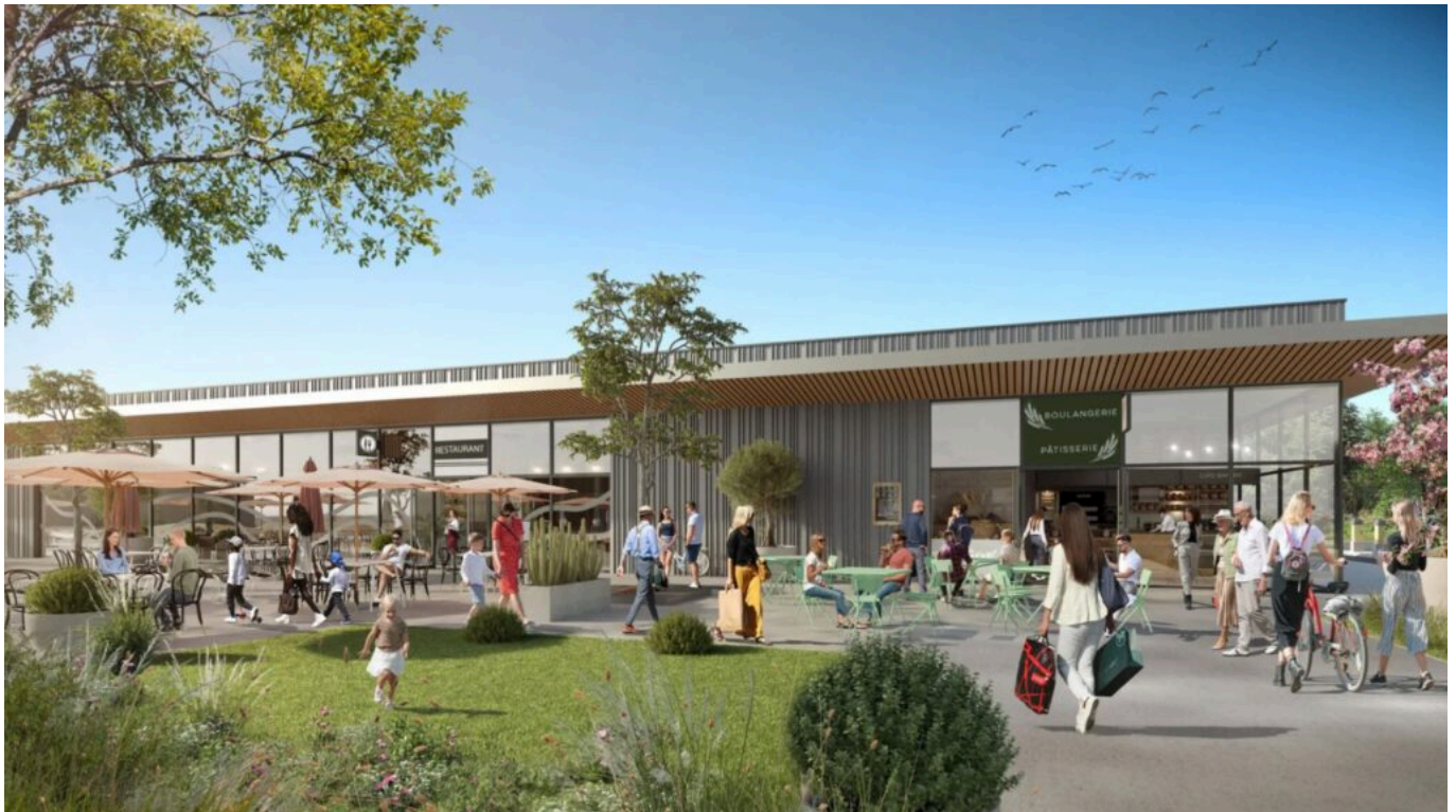
Ce à quoi devrait ressembler la zone commerciale Horizon Provence à terme.

enseignes Thiriet et Krys devraient prochainement ouvrir ainsi que d'autres commerces de manière séquencée au cours du premier semestre de l'année 2025. « Ces commerces et services de proximité proposent une offre accessible, locale et adaptée aux attentes et besoins des visiteurs, privilégiant la qualité, le savoir-faire et le contact humain », explique Horizon Provence.