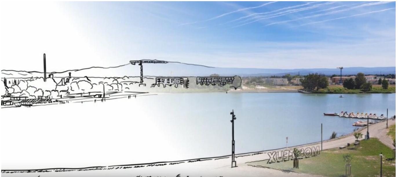
La zone de Beaulieu.

« Nous avons décidé de créer de la richesse. C'est ce que nous avons fait avec Beaulieu. »