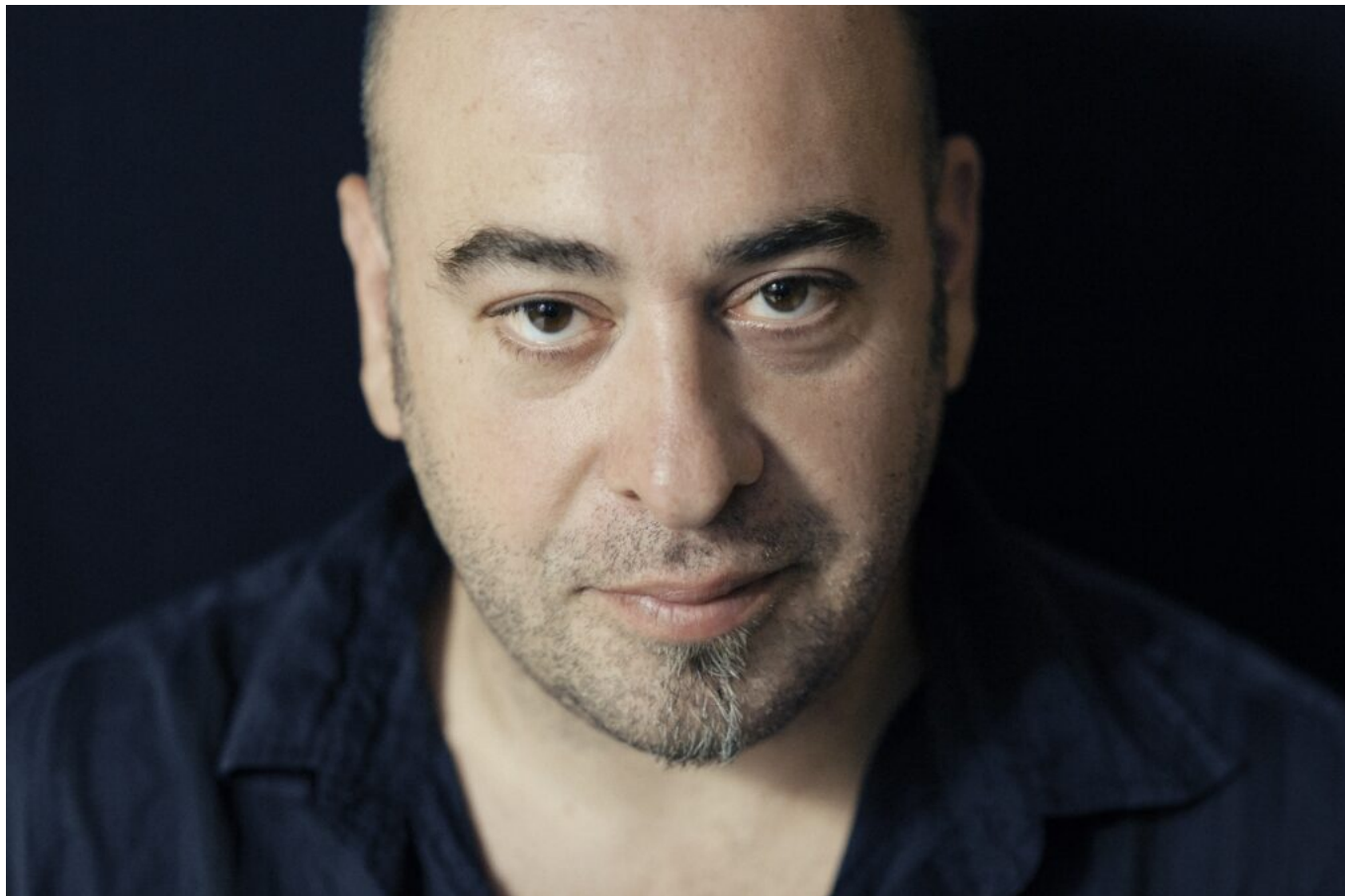
Stephane Belmondo