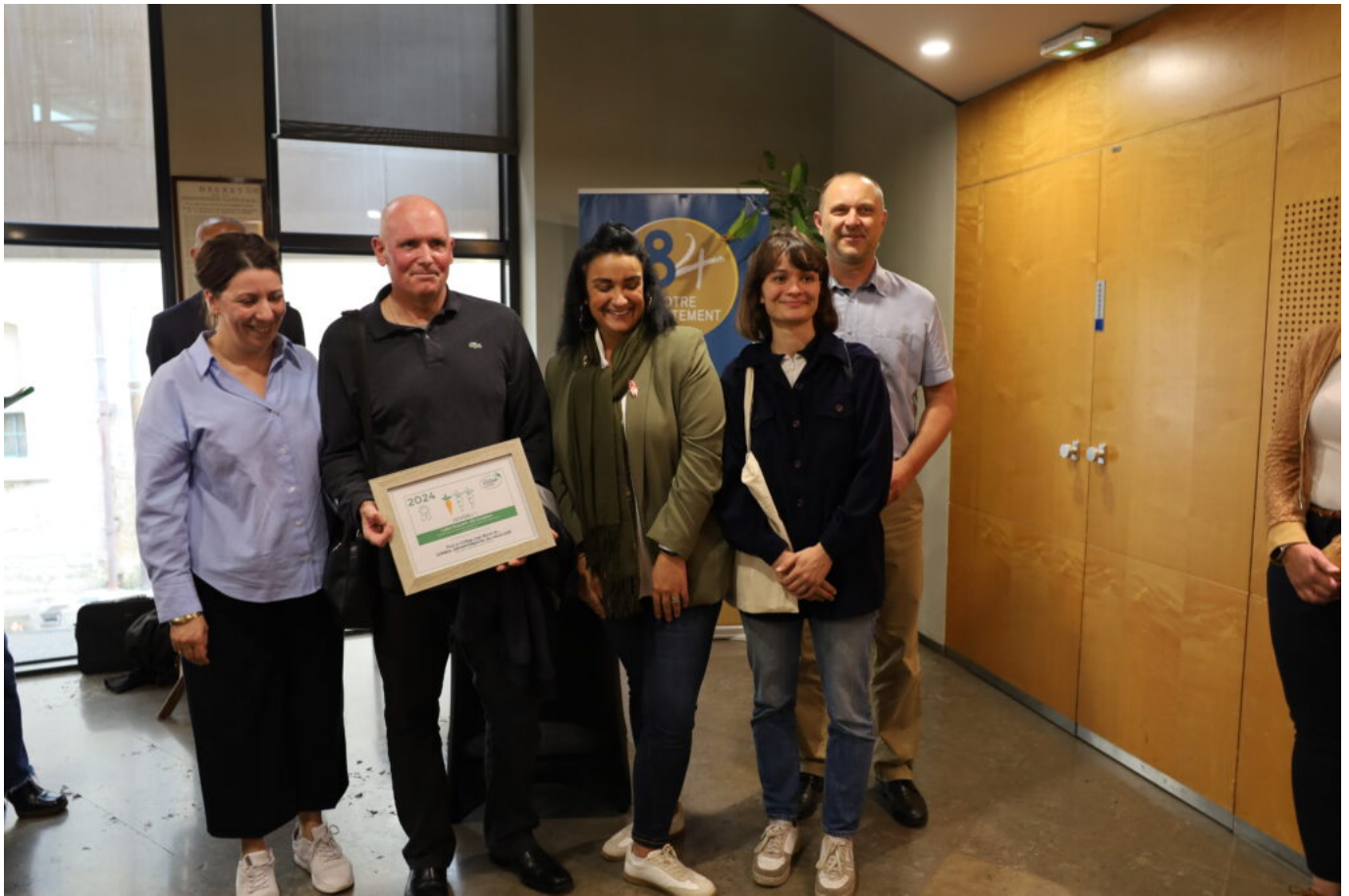
Collège Jean Bouin, Isle-sur-Sorgue