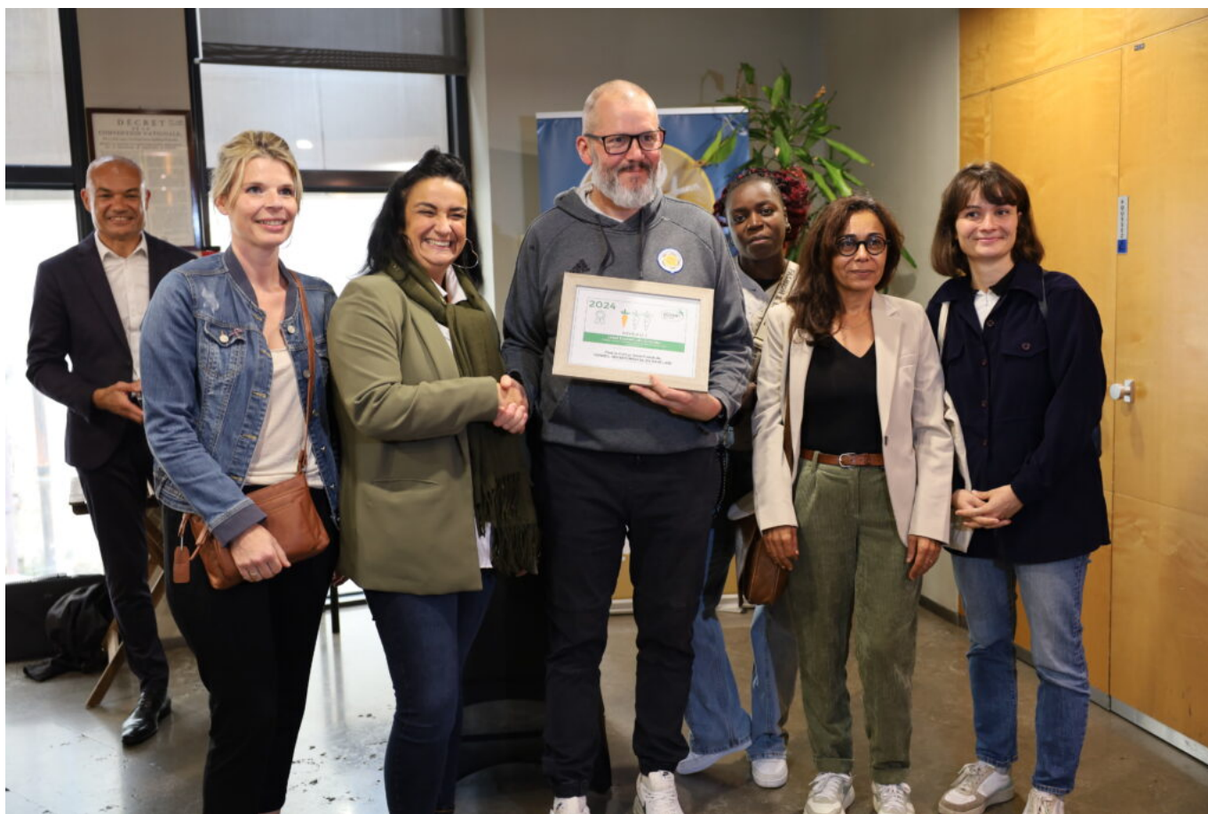
Collège Anne Franck, Morières-lès-Avignon