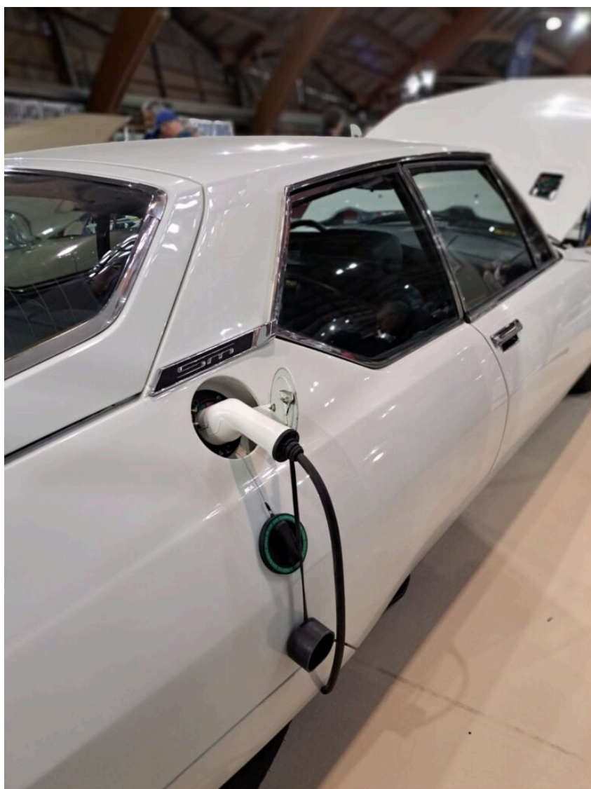
Unique SM Citroën électrique au monde