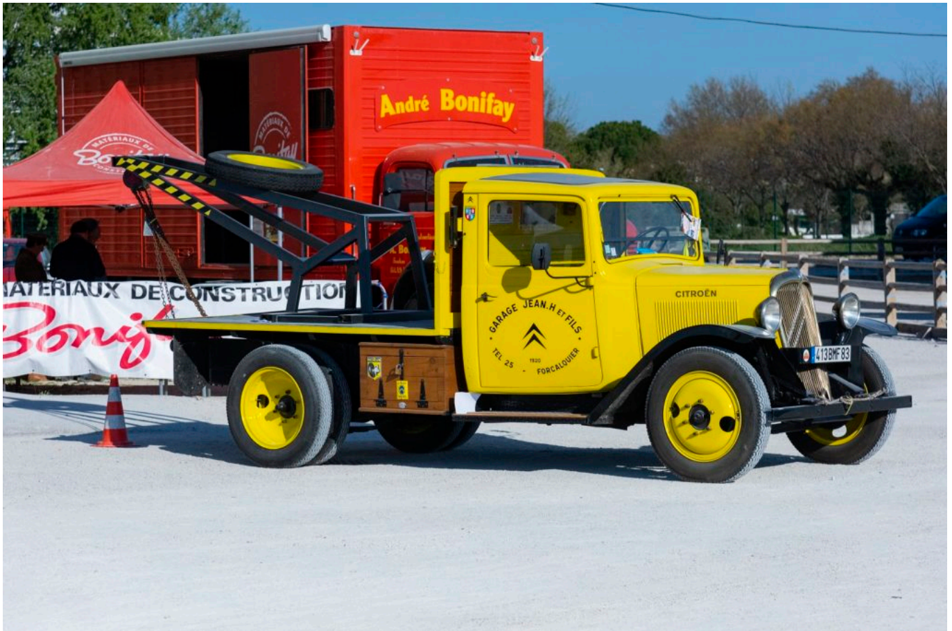
Dépanneuse Jean H et fils

L'association des Amis du Circuit d'Avignon Vaucluse (ACAV) et Avignon Tourisme présentent un plateau Autos-Motos historique directement inspiré des Grands Prix d'Avignon Vaucluse.