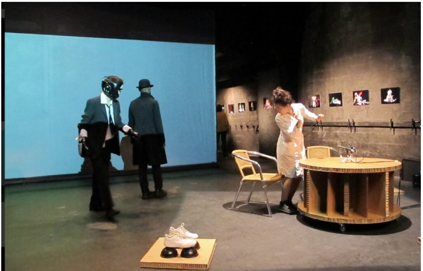
Le volet artistique de Volubilis

Jeudi 27 et vendredi 28 novembre 2025. Avignon. Public concerné architectes, urbanistes, paysagistes, responsables techniques, enseignants et élus. L'intégralité du programme de la formation-colloque ici . Tous les renseignements auprès de Volubilis . 8, rue Frédéric Mistral à Avignon 04 32 76 24 66. Mireille Hurlin