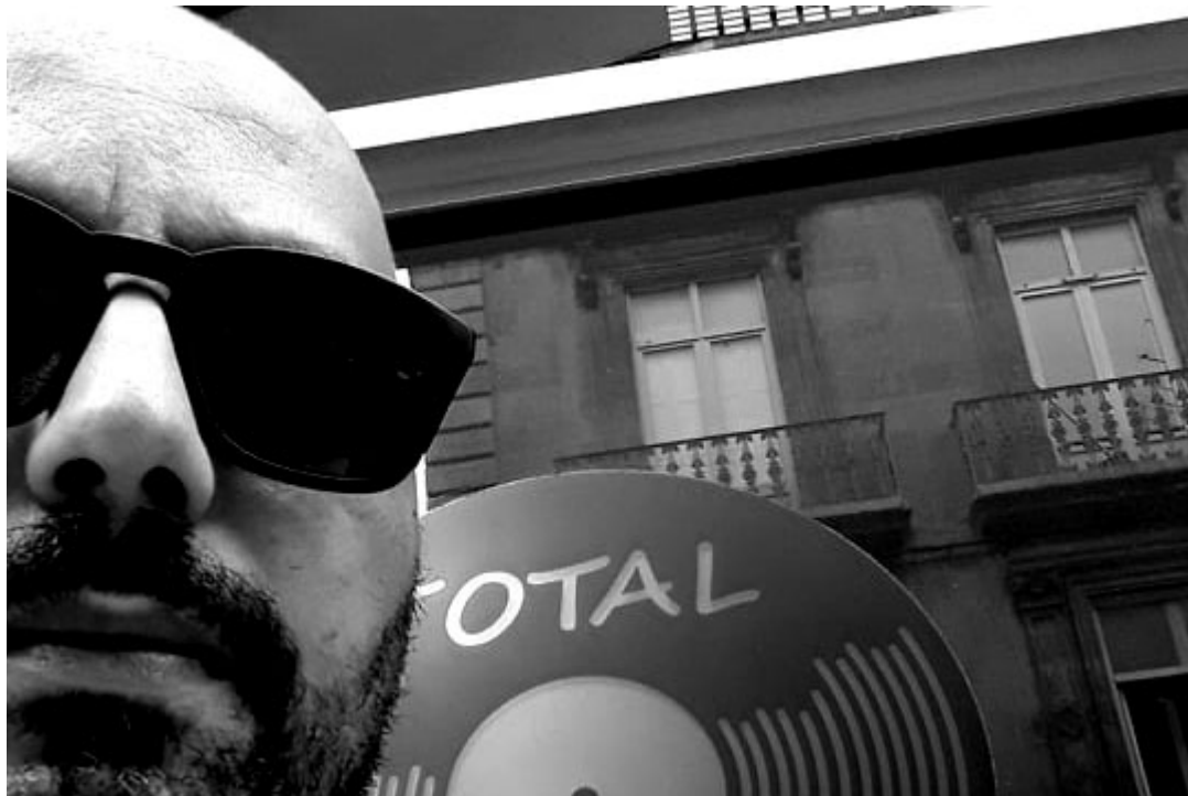
Nacime B

Pour écouter Nacime B, cliquez sur ce lien .