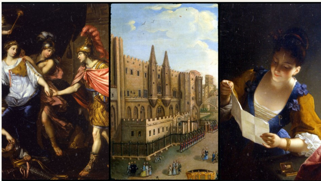
MIGNARD P- La rencontre d'Alexandre avec la reine des Amazones