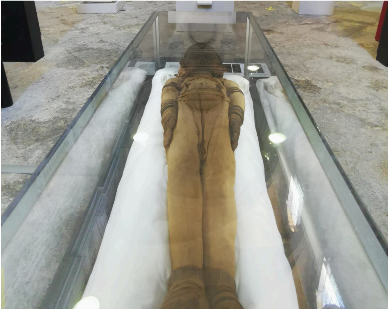
La momie majestueuse repose au cœur des lieux.

L'exposition comporte des bas-reliefs, des statues, des bibelots antiques, des fresques, des ornements... Au musée Calvet, « Au pays de la musicienne d'Amon-Rê » fait se côtoyer amulettes, momies animales et d'imposants et colorés sarcophages.