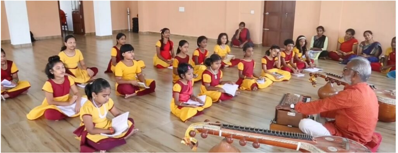
Leçon de chant