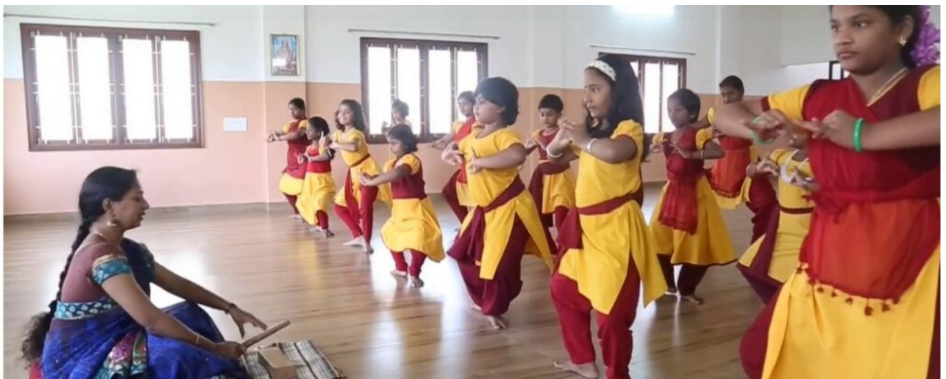
Leçon de danse