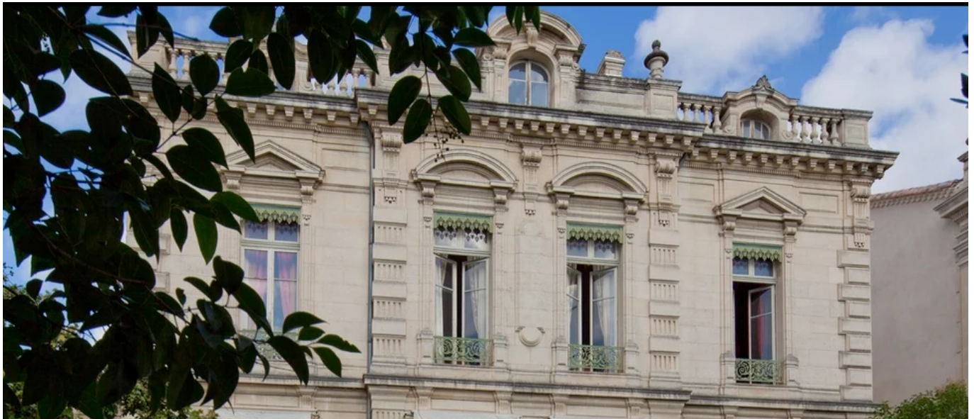
le Musée des arts décoratifs Louis Vouland à Avignon

Atelier d'écriture 'Bonheur du samedi' : Samedi 23 avril.