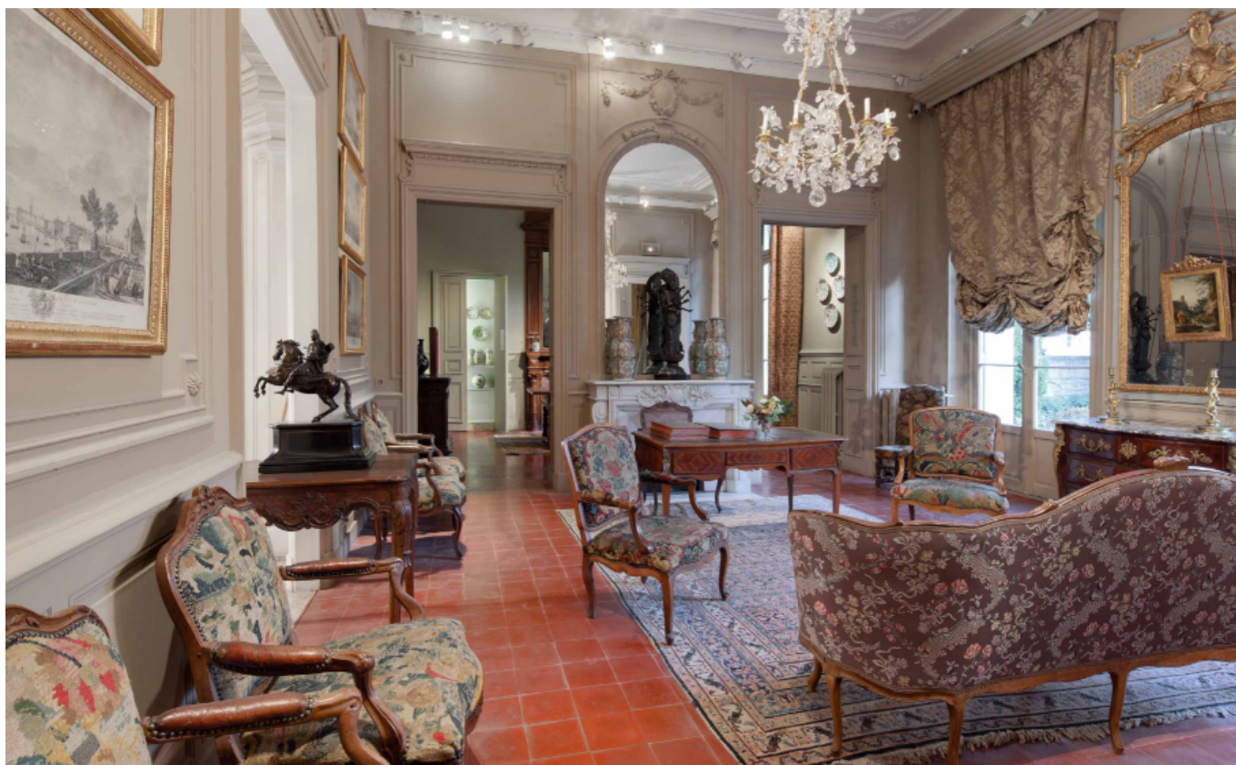
Un des salons du Musée Louis Vouland