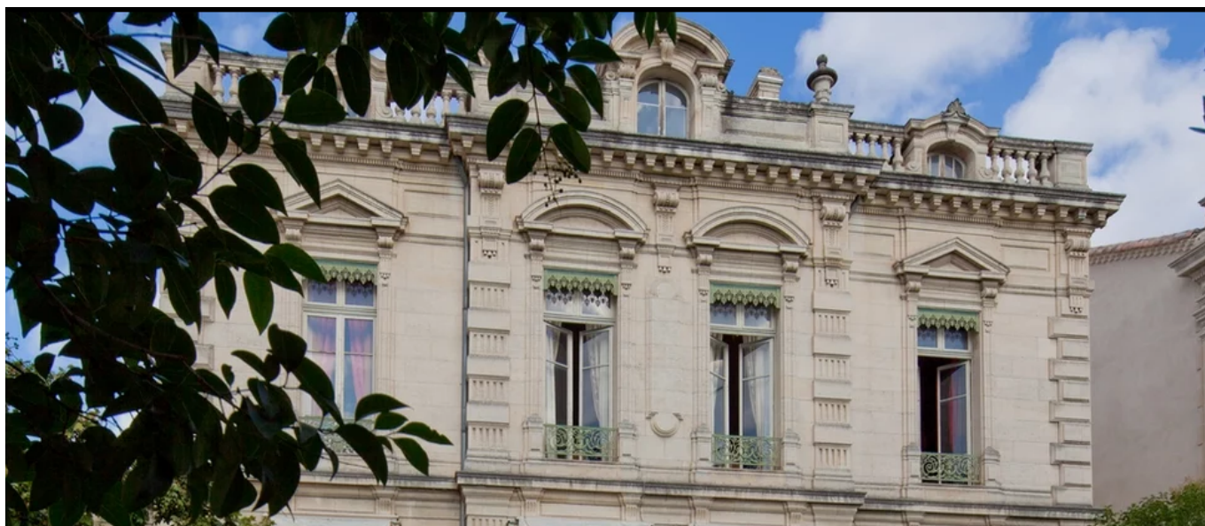
le Musée des arts décoratifs Louis Vouland à Avignon

Atelier d'écriture 'Bonheur du samedi' : Samedi 23 avril.