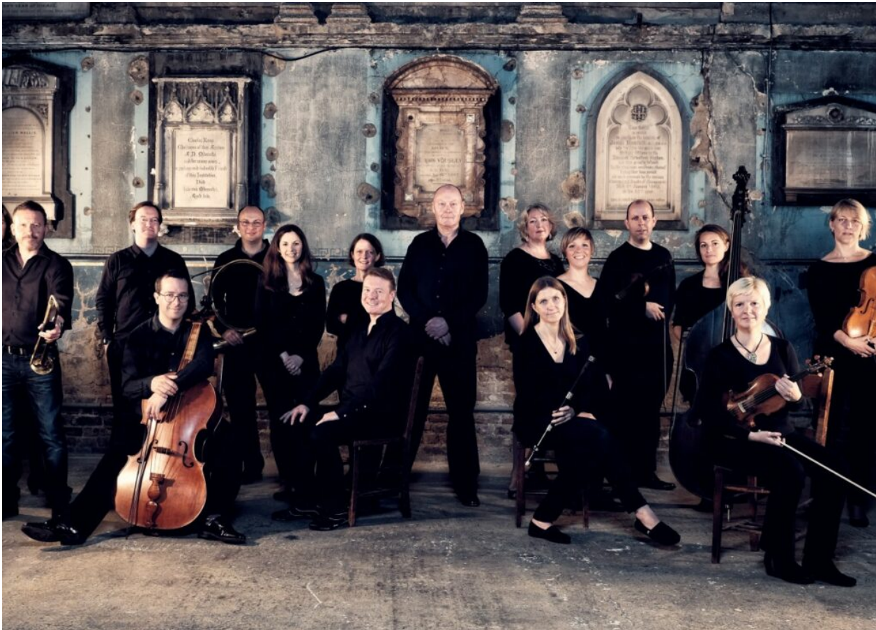
“King Arthur” par le Gabrieli Consort le 09 juillet place de l'Horloge à Ménerbes

A Ménerbes le 9 juillet, mais en plein air sur la Place de l'Horloge l'opéra « King Arthur » de Purcell qui sera dirigé par le londonien Paul Mac Creesh à la tête de son Ensemble Gabrieli Consort & Players et de sopranos, ténors baryton et baryton-basse réputés.