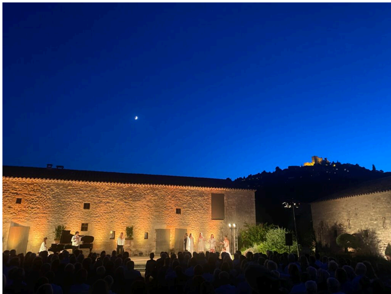
La Maison Basse de SCAD Lacoste accueille régulièrement des concerts.

qu'il faut posséder certaines connaissances pour écouter et apprécier la musique classique. Une tendance que les Musicales du Luberon veulent effacer.